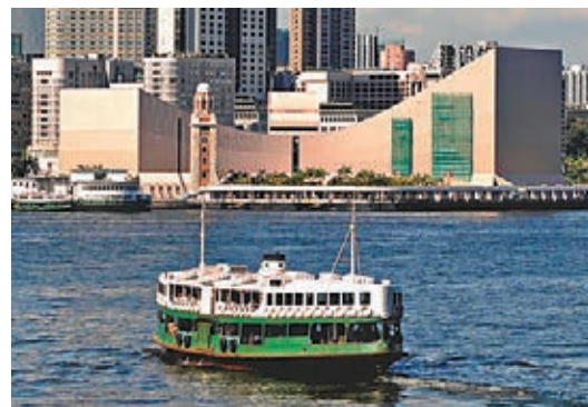
香港獨特城市光譜。

很難有一座城像香港這樣，第一眼極盡繁華琳琅滿目讓你心生歡喜，日子久了，熟稔了些，倒有了種一言難盡的感慨。即便在當地生活了幾十年的香港人，依舊沒法給出準確的措辭去形容這座城市。這座城有它一直看重的東西，像契約精神、法治、民主和自由，但又不僅僅是這些。從中央集權下的邊陲小鎮，到鴉片戰爭的屈辱割讓，從英治到二戰和日佔時期的陷落與苦難，從躋身亞洲「四小龍」的經濟騰飛到八零年代的中英談判，從回歸前的期待與迷茫，再到如今融入大灣區發展版圖的新篇章，這座曾經享有盛譽和無上榮光的「東方之珠」，在一個多世紀裏披荊斬棘、風雨兼程，慢慢淬煉出獨特的城市性格，也形成了獨有的城市光譜。