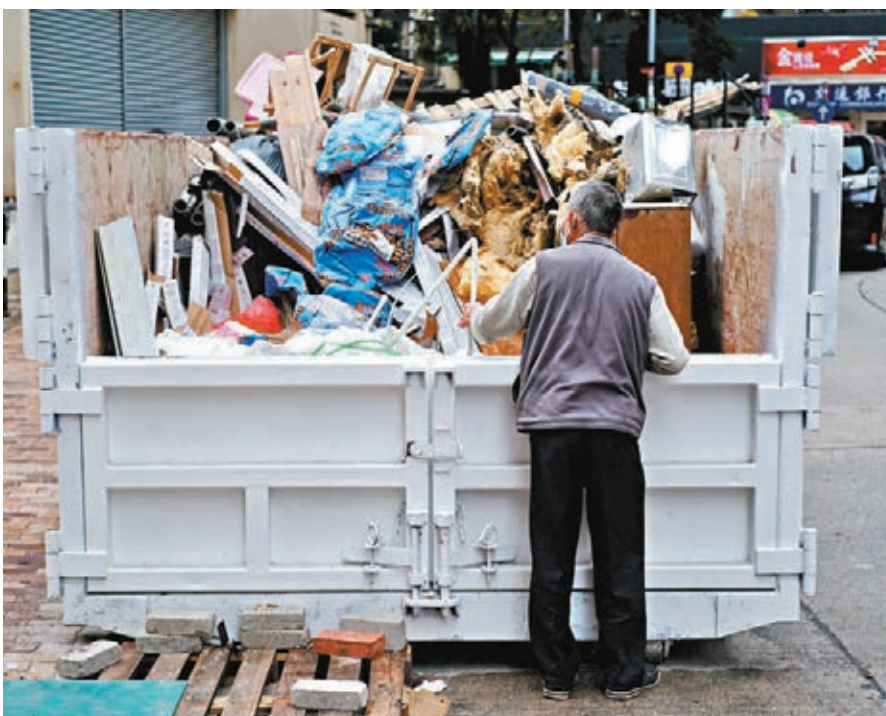
筲箕灣一個放置於路邊盛載裝修工程泥頭垃圾的鐵斗前，一名老翁挑揀可重用物品。

的扶貧成效最為顯著，去年的扶貧成效達3.7個百分點，較2018年上升0.1個百分點，令26.1萬人脫貧。