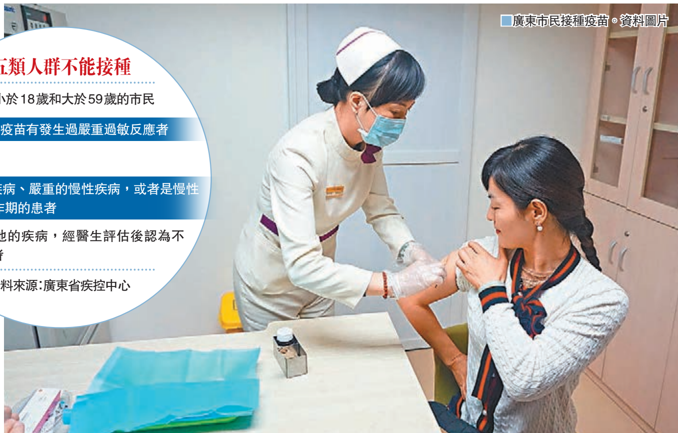
廣東市民接種疫苗。