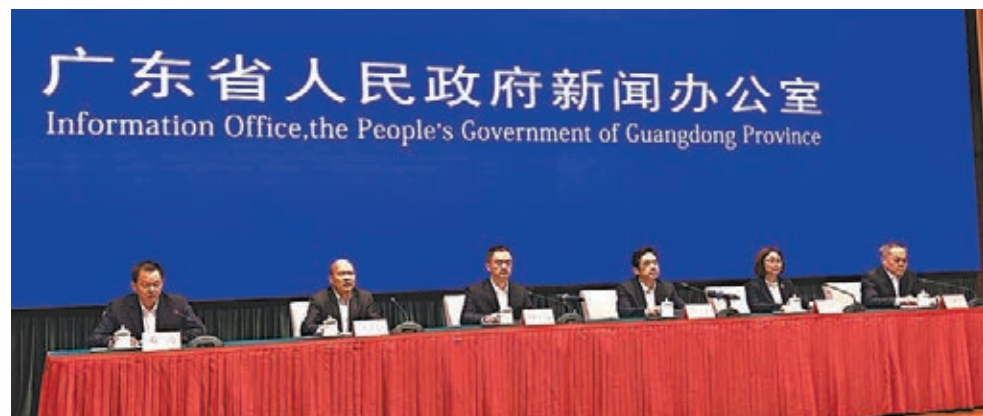
廣東省新冠肺炎疫情防控新聞發布會現場。