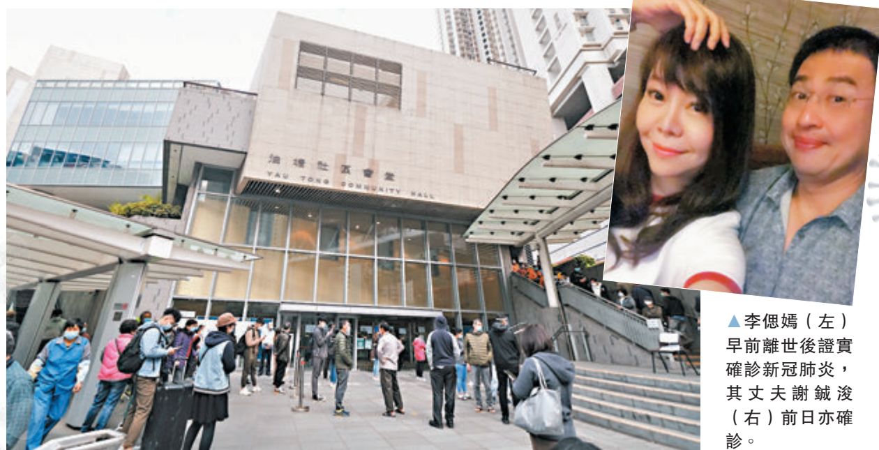
政府昨起為油麗邨居民及工作人員提供免費檢測。

正義聯盟發起人李偲媽早前離世後證實新冠肺炎，其丈夫謝鉞浚日前檢疫期間確診。醫管局總行政經理（質素及標準）劉家獻昨日承認，他們於本月10日將樣本交還元朗容鳳書嬰孩健康院的收集點，檢測結果均是呈陰性，院方於本月14日向他們發出短訊但不成功，「曾經