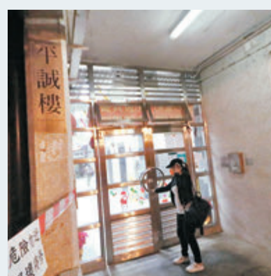
▲平田邨平誠樓昨日再多名住戶初步確診。

另外，平田邨平誠樓昨日再多名住戶初步確診，累積涉及5個單位，若他們最終確診，該大廈住客需要接受強制檢測。此外，昨日再兩座大廈分別累計3個單位出現確診個案，衛生署會向住戶派發樣本樽，包括觀塘花園大廈玉蓮臺累計7人確診，其中兩個單位同層；油美苑潤美閣累計4人確診。