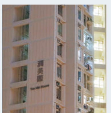
▲油美苑潤美閣累計4人確診。