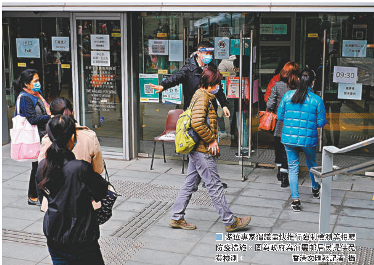
多位專家倡議盡快推行強制檢測等相應防疫措施。圖為政府為油麗邨居民提供免費檢測。

也有市民關注禁足細節，例如政府是否有人手照顧所有市民的起居飲食？禁足禁到什麼程度？哪些商店需要關閉？未能居家進行的工作又應如何維持？