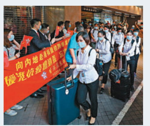
內地核酸檢測支援隊今年9月來港協助抗擊工作，離港時受市民夾道歡送。

他們還請求中央向香港提供更多新冠疫苗，讓香港居民盡早產生群體免疫力；容許已接種疫苗並已產生病毒抗體的香港居民日後來往內地時可豁免檢疫。