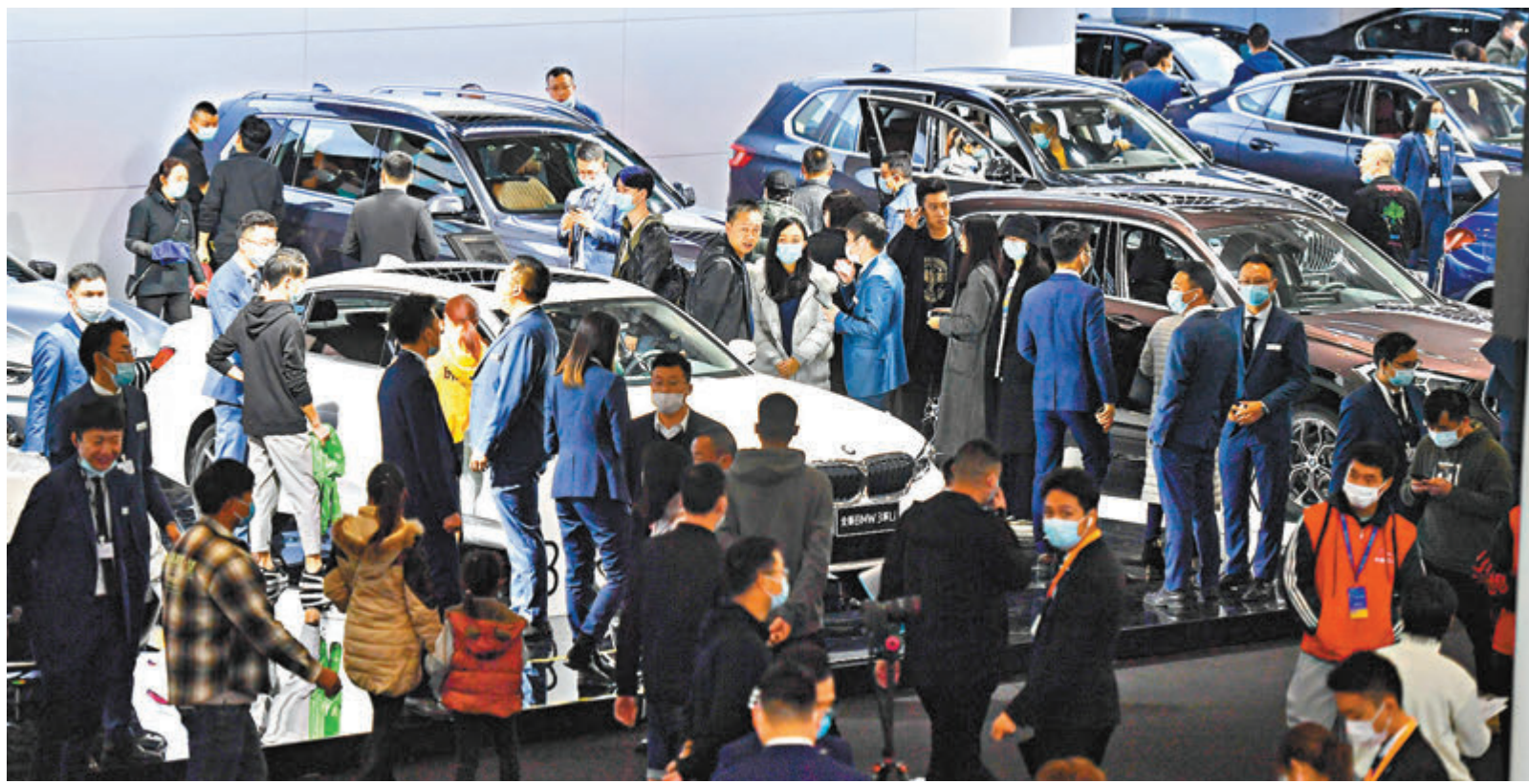
專家建議，適度調整娛樂、服務、奢侈性消費等行業發展的限制性政策。圖為民眾早前在2020(第十七屆)中國西南(昆明)國際汽車博覽會了解心儀車型。