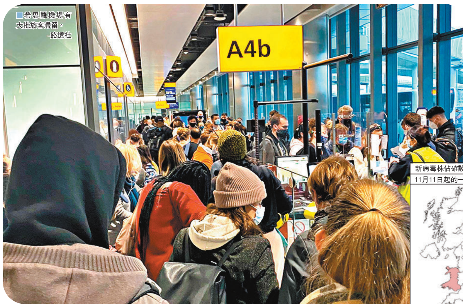
希思羅機場有大批旅客滯留。