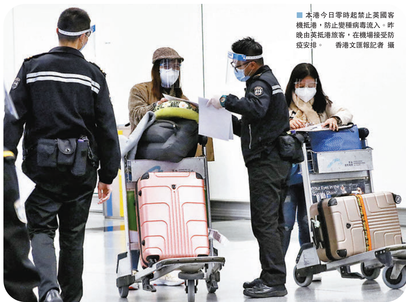
本港今日零時起禁止英國客機抵港，防止變種病毒流入。昨晚由英抵港旅客，在機場接受防疫安排。