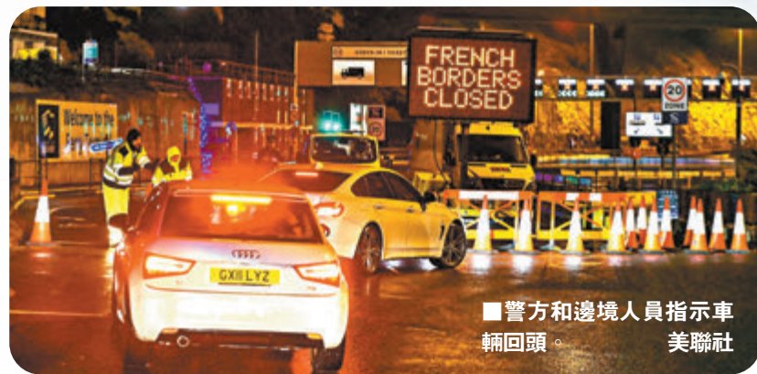
警方和邊境人員指示車輛回頭。

病毒的變種較新冠病毒更快速，科學家需根據病毒變異而適當調整流感疫苗，因此隨着新冠病毒變種，目前不能排除現有疫苗效用降低的可能性。英國公共衛生部高級醫學顧問霍普金斯指出，感染變種病毒的患者，口鼻含有的病毒濃度較一般感染者更高，或是變種病毒傳染力增强的原因。不過霍普金斯強調，病毒觸發免疫系統在肺部出現反應，才是導致病情惡化的原因，因此變異病毒傳染力增加，不一定代表病毒會更致命或導致病情加劇。 ■綜合報道