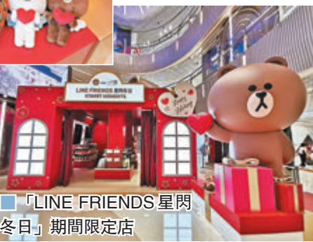
■「LINE FRIENDS 星閃冬日」期間限定店