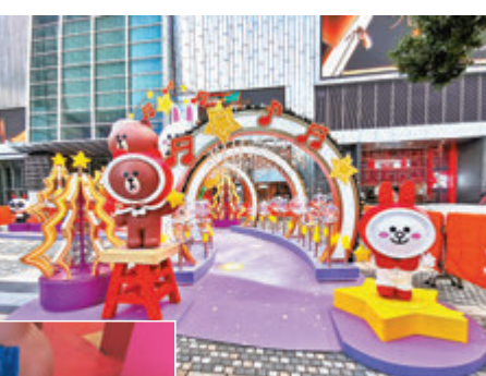
▲ BROWN & FRIENDS 星光隧道

其 7.5 米高的巨型「BROWN & FRIENDS 星閃音樂盒」、「BROWN & FRIENDS 星光隧道」及「BROWN & FRIENDS 霓虹浪漫打卡牆」不容錯過，如星閃音樂盒底座以 60 個擁有不同造型的薑餅人圖案作裝飾；星光隧道更有以 12 種不同語言表達「愛」的燈牌。同時，商場中庭還設「LINE FRIENDS 星閃冬日」期間限定店，由 3.5 米高的 MEGA BROWN 帶來全新登場及極具收藏價值的 BROWN & FRIENDS 系列精品，另還準備了 7 款「星閃冬日限定禮品」以供 NINA CLUB 會員換領。