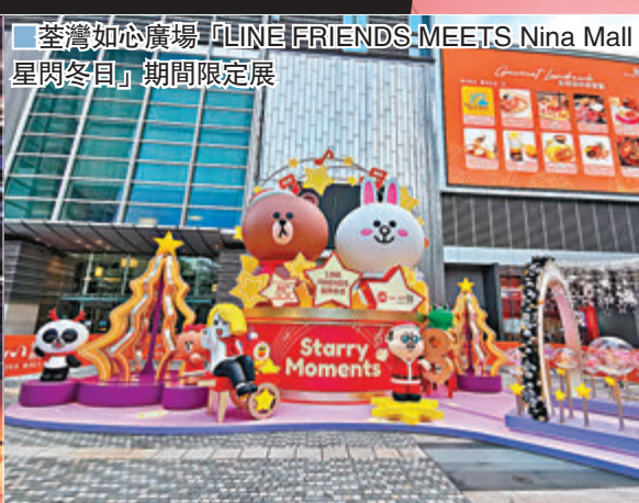
■荃灣如心廣場「LINE FRIENDS MEETS Nina Mall 星閃冬日」期間限定展