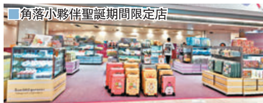
■角落小夥伴聖誕期間限定店