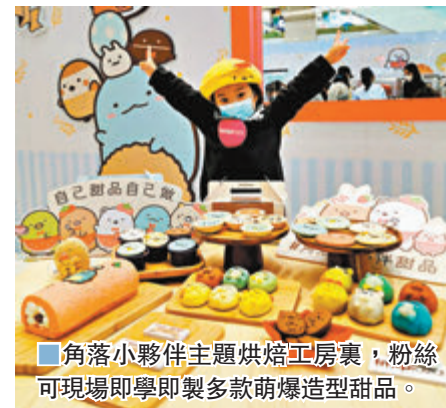
■角落小夥伴主題烘焙工房裏，粉絲可現場即學即製多款萌爆造型甜品。