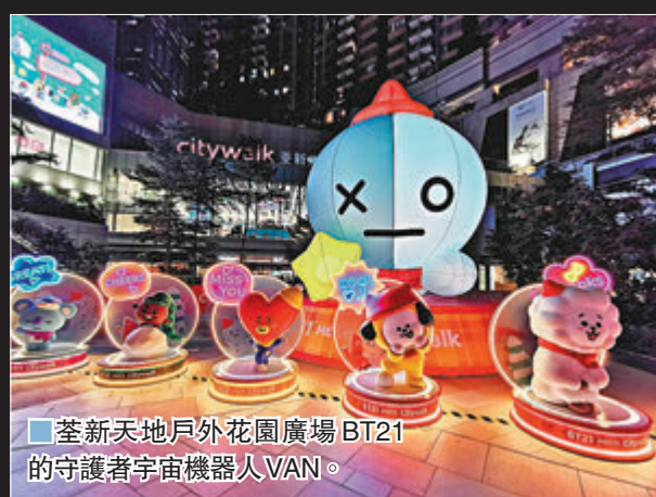
■荃新天地戶外花園廣場BT21的守護者宇宙機器人VAN。