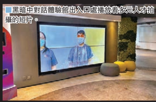
黑暗中對話體驗館出入口處播放着多元人才拍攝的短片。

走入全黑的世界，我們也許會感到害怕，但這就是視障人士的世界，那裏雖然沒有色彩，但仍然溫暖。「黑暗中對話賽馬會對話體驗館」早前從美孚遷址至荔枝角，並推出「黑暗中對話賽馬會對話學院」。新館開幕，為配合潮流，新館增添了多個數碼元素，並在機構的多元人才（機構之殘疾人士員工）帶領下進行各種遊戲，以體驗殘疾人士的生活，「暗」中作樂，達至傷健共融。