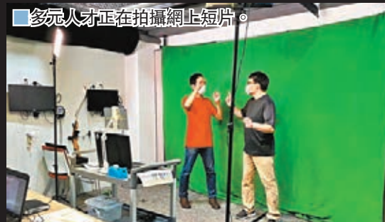
多元人才正在拍攝網上短片。