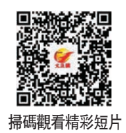
掃碼觀看精彩短片