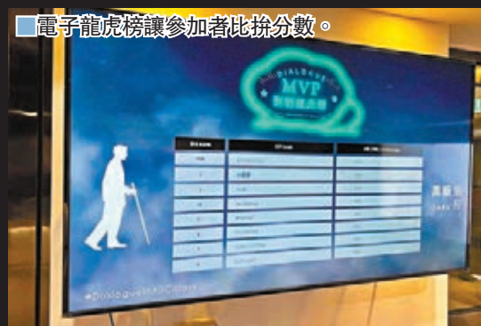
電子龍虎榜讓參加者比拼分數。