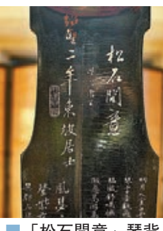
■「松石間意」琴背面左邊刻有「吳趨唐寅」、「紹聖二年東坡居士」。

遇知音之典故，古琴後人視為「君子之器」。古琴在古代只稱「琴」，到了近代為了與鋼琴、小提琴等西洋樂器區別，才冠以「古」字，古琴似乎永遠與時風相悖，無論在哪个朝代，奏響的永遠是古音。琴之美，外表大多素面朝天，歷代古琴也多为素琴，但也有好者在琴面上八寶髹漆，甚至精雕細刻，鑲金戴銀，但