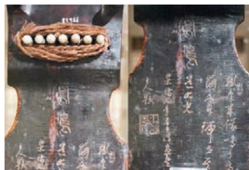
■篆書琴名「鳳鳴」二字，其下陰刻行草四言詩兩行「鳳皇來儀，鳴於高崗，文章瑞世，其道大光」。