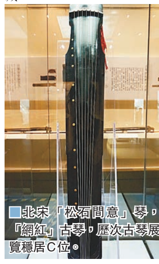
■北宋「松石間意」琴，「網紅」古琴，歷次古琴展覽穩居C位。

在琴界負有盛名，是古琴界的「網紅」，原因是琴身上的13則銘文，多為宋明清著名文人——蘇東坡、沈周、唐寅等名家題字，實屬罕見。該琴通體黑漆，琴面蛇腹斷紋，底部細密流水斷紋。工作人員介紹，該琴最初歸北宋文豪蘇東坡所有，琴背上一排字即是蘇東坡1095年所題；明代時，該琴被「江南四大才子」之一唐伯虎收藏；清代之後，該琴一直被江浙一帶文人收藏。