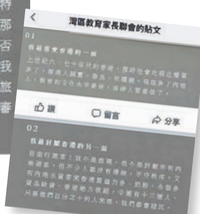
教材被質疑觀點偏頗，誤導學生。網上截圖

03 我認為香港要成爲一個可持續發展的城市 香港人基本上都有禮貌、乾淨，人與人之間有互信，也保持適當距離，且容易接受新思維，人情味濃。在香港，你不會看見有嬰兒被汽車輾過，而沒有人伸出援手。我們一定要保存這些特色，不能變成內地城市那樣。我不肯定特區政府能否限制內地人來港，就好像我們去美國一樣，必須申請旅遊簽證，再經當地政府審批，才獲准入境。