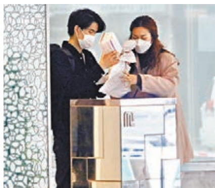
陸續有海外抵港的檢疫者到酒店。