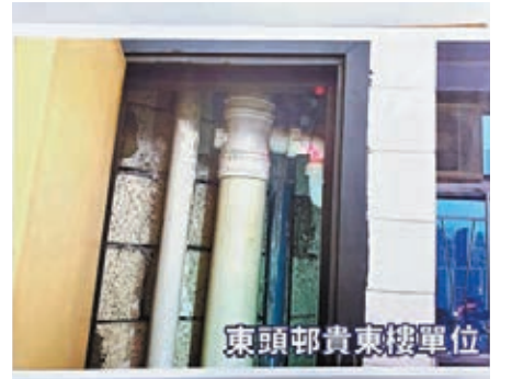
專家巡查東頭邨貴東樓單位。