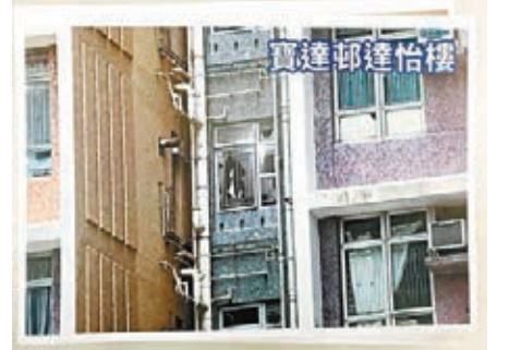
寶達邨於2000年後入伙，屬於較新公屋，部分大廈樓高40層，房署也有為此進行改良設計。