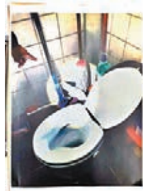
民建聯指房署用英泥封滲水位。