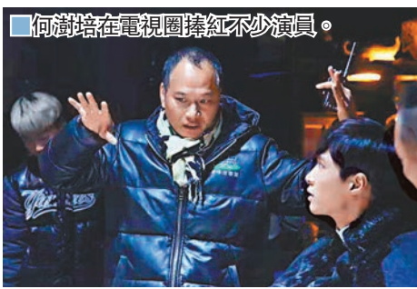
何澍培在電視圈攪紅不少演員。