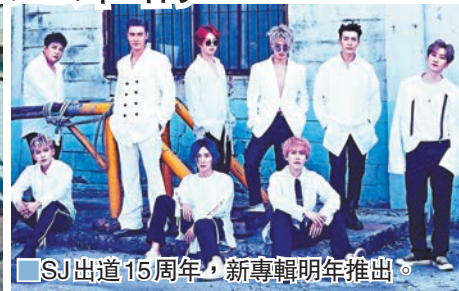
SJ出道15周年，新專輯明年推出。

眨眼間，SUPER JUNIOR（暱稱SJ）就迎來他們出道15周年紀念，作為一個偶像男團，真的殊不簡單。由於一早已計劃了一連串的慶祝活動，SJ原定計劃於12月發行的第十張正規專輯，是紀念祝賀出道15周年的，礙於新冠疫情的關係，公司方面決定將發售日期延至2021年1月。唯早前已錄製的《一周偶像》、《認識的哥哥》綜藝電視節目，由於播出日期已一早排定，故如期陸續播出。