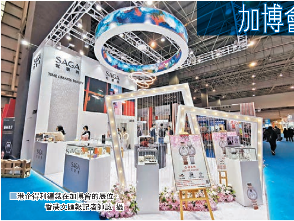
港企得利鐘錶在加博會的展位。

香港文匯報訊(記者 帥誠 東莞報道)17日,第十二屆中國加工貿易產品博覽會(下稱加博會)在東莞開幕,1,193家企業參展,其中港資企業共37家112個展位。今年海外市場因疫情受阻,不少參展商都積極開拓內地市場,老牌港企得利鐘錶不僅與中國航天、熱門電影等跨界合作推出新品,還在展會上設立直播間,以最高七折的優惠現場直播帶貨。另有港商去年開始創立新品牌針對內地市場推廣,負責人稱不斷加大技術研發力度推出新品成為在內地市場站穩腳跟關鍵。