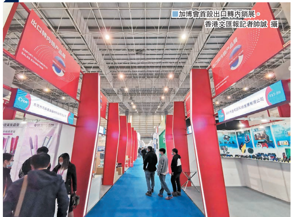
加博會首設出口轉內銷展區。

事實上,除了廣州花都、湖北荊州等國內工廠,廣州花都匯龍皮件早年還在孟加拉和印尼設立了海外工廠用於分擔風險。「所以我們成功避免了去年中美貿易戰時的關稅影響。」他說。