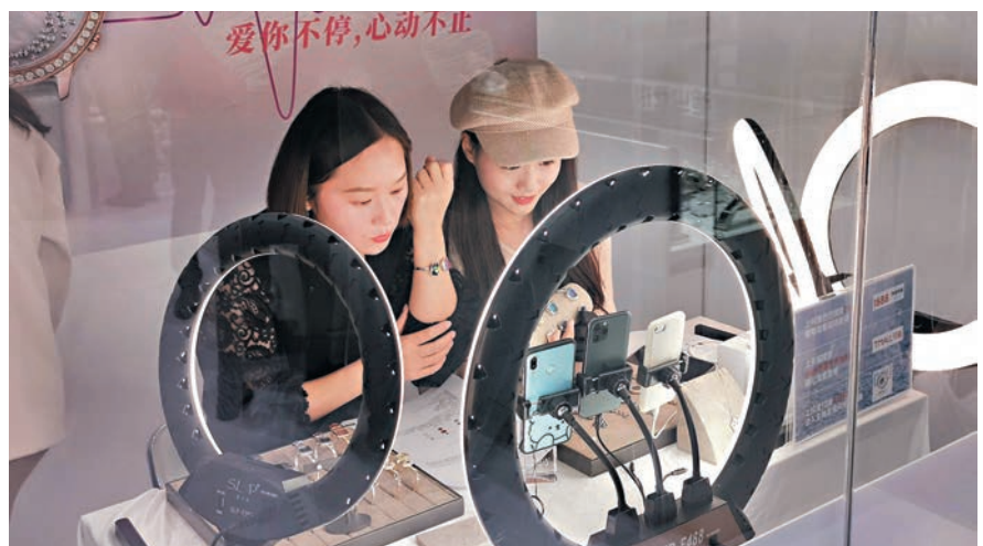
得利鐘錶在展會搭建的直播間。

「我們將每天進行兩場直播,每場活動持續3小時。根據不同系列產品推出七折至九折不等的限時優惠價。」得利