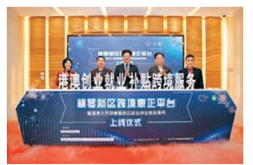
橫琴「跨境惠企平台」、港澳人員到橫琴新區就業創業補貼服務上線儀式。

香港文匯報訊(記者 方俊明 珠海報道)「跨境惠企平台」17日在珠海橫琴新區上線,為港澳人員提供225項政務事項不出境,線上跨境通辦。而「港澳人員到橫琴新區就業創業補貼服務」同時上線啟動,實現港澳身份線上核、領補貼「零跑動」,將吸引更多港澳居民到橫琴就業創業。