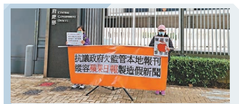
抗議縱毒果 《蘋果日報》被批評長年報道假新聞，製造社會對立和撕裂，有市民昨日到政府總部外發起集會，指《蘋果》在市民眼中是「製造謠言謬論的假新聞公司」。近日，《蘋果》老闆黎智英的私人助理更捏造虛假調查報告，干預美國總統大選及抹黑內地，嚴重影響香港傳媒在國際間的聲譽，他們要求商務及經濟發展局局長邱騰華依法打擊假新聞。■香港文匯報記者 子京

香港文匯報訊(記者 蕭景源)巧立名目搞單籌的「好鄰舍北區教會」，月初被以涉嫌「欺詐」及「洗黑錢」罪名調查，凍結2,500萬元資金、拘捕前董事和職員，並通緝「傳道人」陳凱興夫婦。受僱涉案教會、因阻差辦公被判囚等候上訴的攬炒社工劉家棟，當日有份協助警方調查，加上「好鄰舍」戶口被凍結，令劉家棟無糧出。他昨日一「割席」，宣布辭任「好鄰舍北區教會」社工及一切職務。「好鄰舍北區教會」以各種名目等搞單籌，包括以「被捕社工工作支援」名義，今年8月為被判囚獲保釋等候上訴的社工劉家棟單籌兩年薪金，並於今年9月1日以單籌資金聘請劉家棟。本月8日，警方懷疑「好鄰舍北區教會」涉嫌欺詐及洗黑錢，持搜查令搜查教會會址等多個地點，並拘捕24歲教會前董事及37歲現職女員工。據悉，劉家棟當日被警方帶走及協助警方的搜查，但未有被捕。擔任教會董事及公司秘書的陳凱興夫婦則已於10月離港，現被警方通緝。「好鄰舍北區教會」事後死撐該會「賬目清晰」、無懼對簿公堂，又揚言警方行動是「政治打壓」，但其後被警方踢爆其用至少6種名義搞單籌，款項卻進入同一個戶口，質疑其賬目混亂，難以分清款項所針對的用途。今年8月，該教會宣稱單籌890萬元，但其實戶口內已存有2,700萬港元，警方懷疑有人以宗教、支持年輕人等名義，欺騙市民善心及捐款，並刻意隱瞞所需款項的實際金額。警方事後凍結5個相信曾處理相關款項的銀行戶口，涉及2,500萬港元。「好鄰舍北區教會」本月11日稱，事發後收到「同路人」關於捐獻的查詢，但因教會正尋求法律意見，所以未能接受任何捐獻。由於該教會的資金進出渠道被截斷，劉家棟的薪金同樣亦被凍結，昨日他在facebook稱，已正式辭任「好鄰舍北區教會」社工及一切職務，聲稱面對再次失業，對前景感到迷惘，但又惺惺作態稱：「但願辭任能減輕教會及同事面對極權的風險。」劉家棟涉去年7月27日在元朗阻礙警方推進，今年6月在粉嶺裁判法院被裁定阻差辦公罪成，判監一年，是修例風波中首名判囚的註冊社工，劉家棟不服定罪及刑罰，當時申請保釋等候上訴，但遭裁判官拒絕，至6月23日他向高等法院原訟庭申請保釋等候上訴，獲准以現金10萬元保釋，須每星期到警署報到兩次，其間不得離港，其上訴聆訊今日將於高等法院由法官黃崇厚處理。