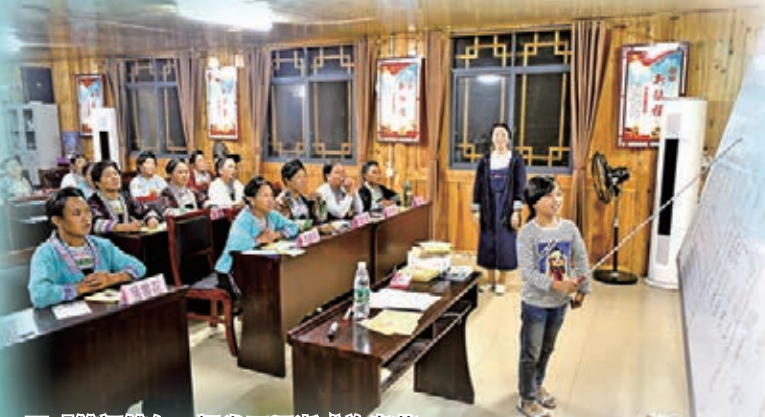
「雙語雙向」課堂正逐漸成為為英婦女溝通世界的橋樑。新華社

回望過去是為了更好地展望未來。近三年來，全國政協和地方政協農委較好完成了各項重點工作，成果豐碩、有聲有色。新的一年，各級政協農委將更加開拓進取、奮發有為，為做好新時代「三農」工作作出新的更大貢獻。