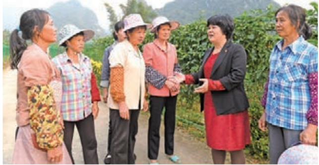
全國政協委員杜麗群(右二)在廣西百色市田陽縣坡洪鎮新洞村向當地婦女了解農村醫療保障情況。