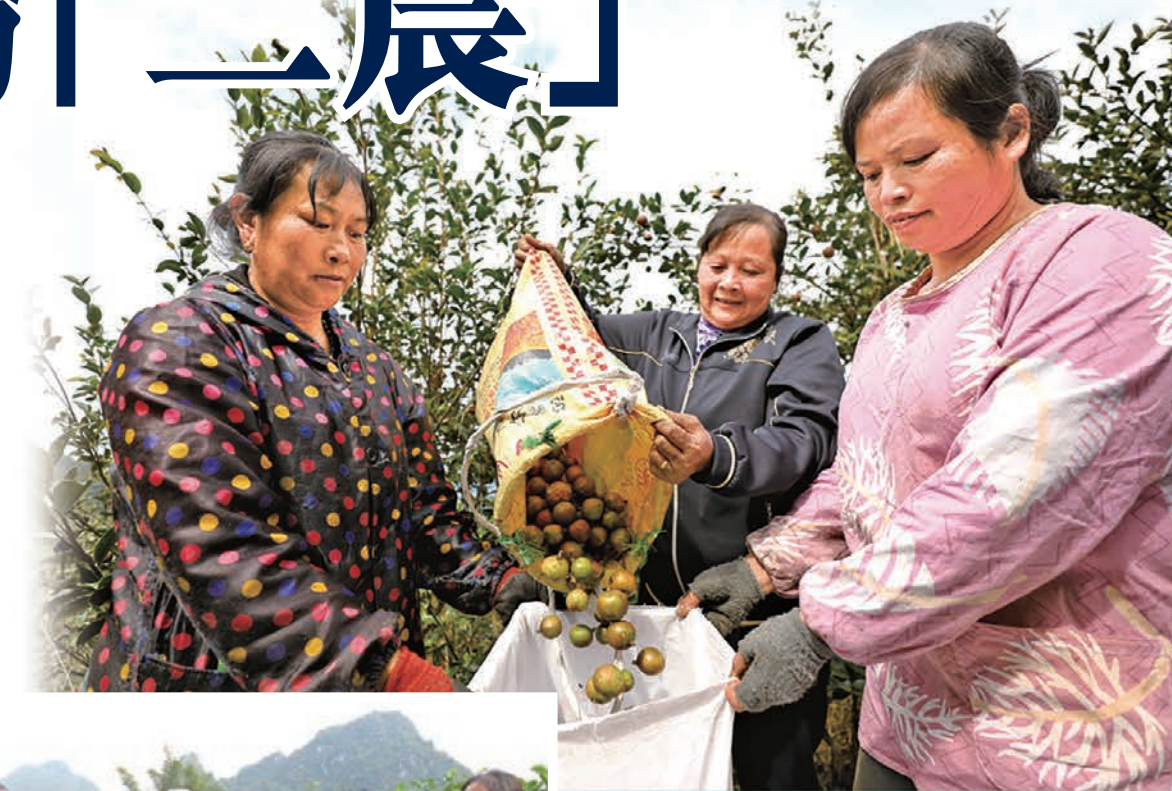
廣西三江油茶豐收助脫貧。圖為茶農將採摘的油茶果裝袋。

全國政協農業和農村委員會主任羅志軍總結了農業和農村委員會作為全國政協最「年輕」的專委會，成立近三年來的良好工作局面，並就明年政協農委工作提出設想。他表示，委員會成立近三年來，共牽頭或參與承辦3次專題議政性常委會會議，3次雙周協商座談會，2次網絡議政遠程協商活動；組織召開3次「三農」工作對口協商座談會，3次重點關切問題情況通報會，開展21次實地調研視察和10多次網絡調