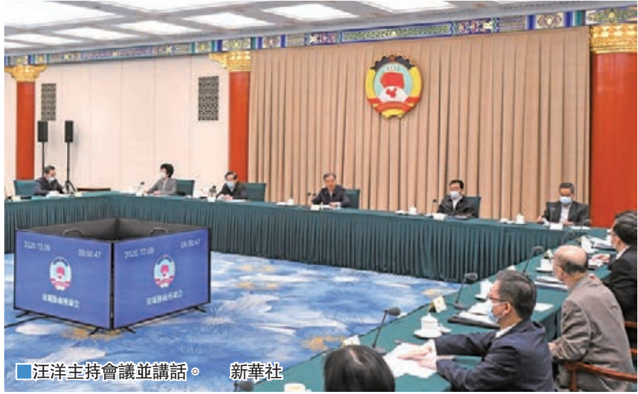
汪洋主持會議並講話。

全國政協副主席張慶黎、梁振英、李斌出席會議。全國政協副主席萬鋼作主題發言。全國政協委員耿惠昌、劉利民、邵旭軍、閻小培、韓平、徐西鵬、劉以勤、劉月寧、吳旭洋、周春玲和專家學者趙陽在會上發言。教育部負責人介紹了有關情況，中央統戰部、外交部、文化和旅遊部負責人作了協商交流。