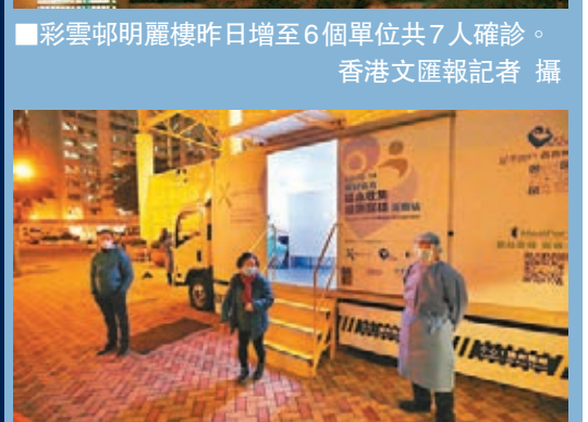
警員進入明恩樓執行任務。