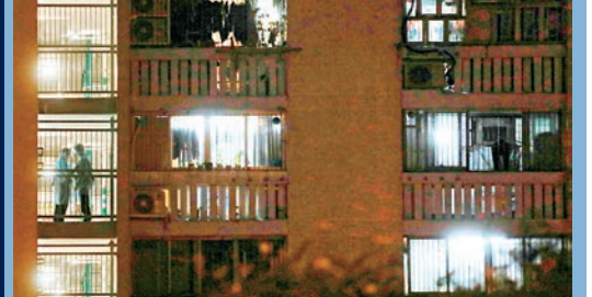
彩雲邨明麗樓昨日增至6個單位共7人確診。