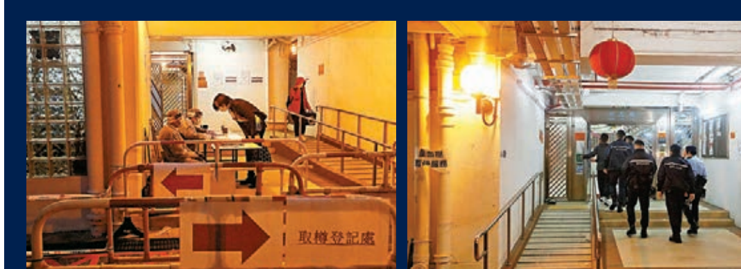
本月曾到訪明恩樓32樓的人及居民須強制檢測。