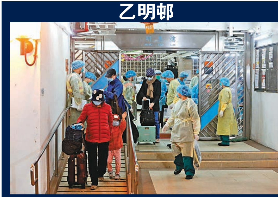
沙田乙明邨明恩樓正在撤離部分住戶。

衛生防護中心早前到東頭邨貴東樓採集29個環境樣本，張竹君指，其中有3個樣本呈陽性，樣本位於有關單位廁所的去水喉表面、廁所的抽氣扇等，但病毒量不高。