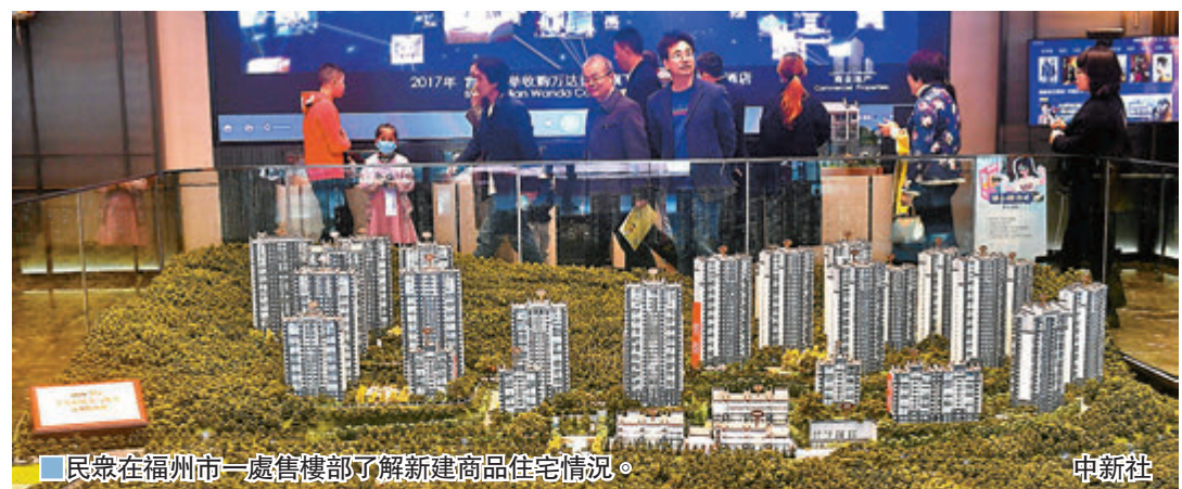
■ 民眾在福州市一處樓樓部了解新建商品住宅情況。

「以上事實充分體現了瀾湄國家間水資源合作所取得的成績。中方歡迎域外國家對瀾湄國家開發利用水資源提出建設性意見，但我們堅決反對惡意的挑撥。」汪文斌說，事實勝於雄辯。中方將堅定不移推進瀾湄水資源合作，為六國共同應對旱澇災害、促進可持續發展作出更大貢獻。