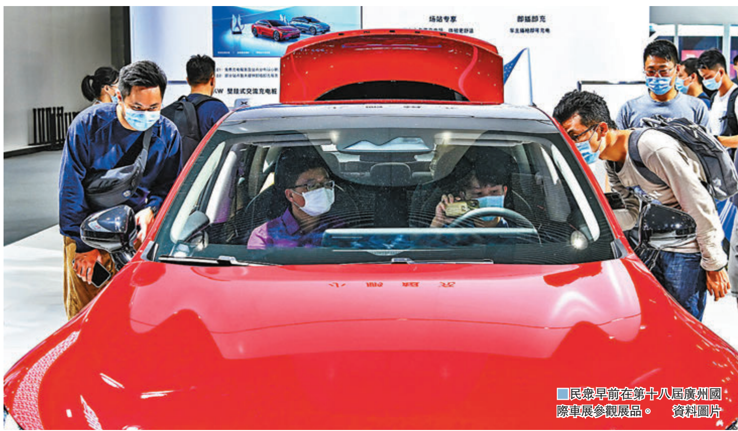
■ 民眾早前在第十八屆廣州國際車展參觀展區。

在增加居民收入方面，央行提出推進改革，通過金融開放，加強國內金融體系、金融市場以及金融制度規則與國際的對接，允許外資深度參與國內資管市場，為增加居民財產性收入提供更多樣化的渠道。同時，引入更多金融機構和專業投資