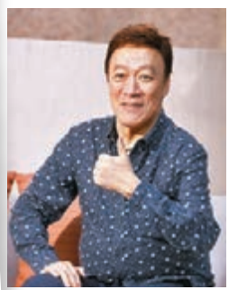
陳欣健都曾為應否北上而掙扎。