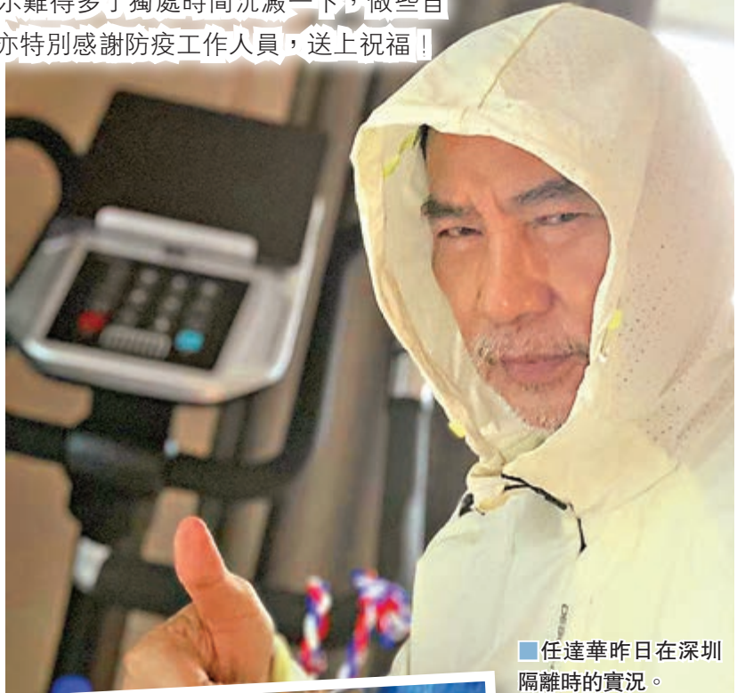
任達華昨日在深圳隔離時的實況。

香港文匯報訊(記者 焯鈴、凡文) 新冠疫情肆虐近一年,香港疫情反覆令不少人的生活大受影響,香港藝人的工作幾近全面「冰封」,正如陳奕迅早前所言在一年疫境下,他染上了「嚴重荷包硬化」,為了生計要回內地工作。為珍惜現有的工作機會,不少港星寧願來回隔離28天也北上開工。目前有不少港星都選擇逗留內地,如譚詠麟、鍾鎮濤、曾志偉、胡杏兒等。曾經歷過隔離日子的眾星都心態正面,表示難得多了獨處時間沉澱一下,做些自己喜歡的事。他們亦特別感謝防疫工作人員,送上祝福!