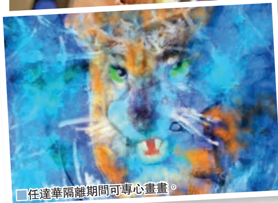
任達華隔離期間可專心畫畫。