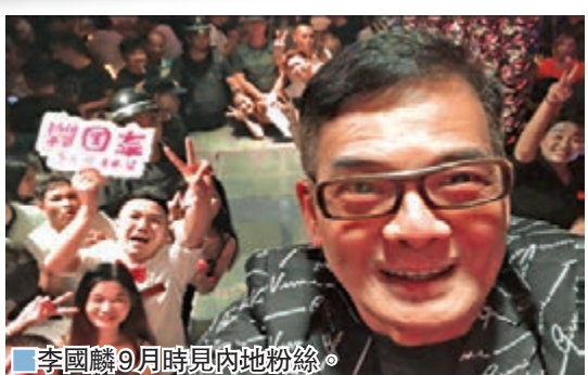
李國麟9月時見內地粉絲。

許多人害怕面對28日的隔離生活而不敢出埠,然而任達華四出四入內地,可謂隔離經驗豐富。現正在深圳酒店進行隔離的他接受本報記者電話訪問時表示,「自從爆發新冠肺炎以來自己四出四入內地,今次尚有幾天就完成了。」心態非常正面的華哥說:「好快可以回港見家人了,有些人會選擇一直留在內地半年不回來,我就不想,回來同太太女兒相處十日再走也好,28日咪28日囉,要做個負責任的男人!明年我再去拍戲,還是去泰山外景,人生第一次上泰山,很期待。」華哥希望陸續有人找他去做中國四大名山拍戲,到時又可滿足他的攝影愛好。