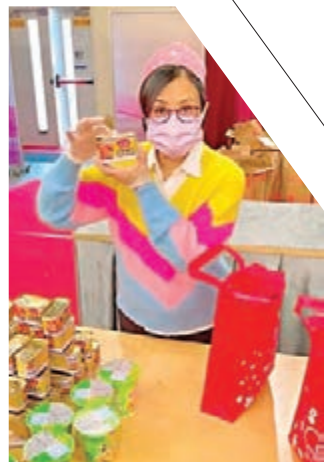
冬至,汪明荃亦不忘一班長者。