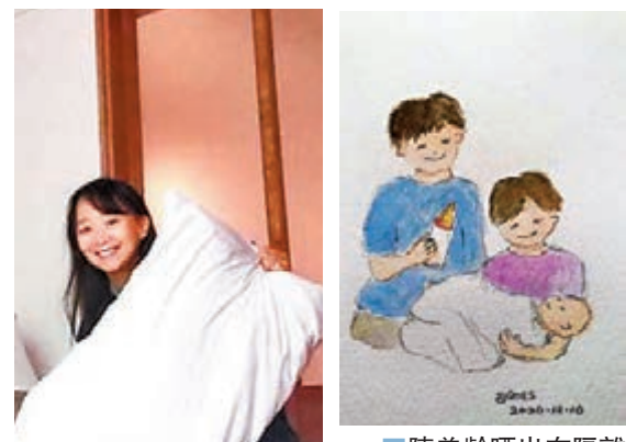
陳美齡晒出在隔離時繪畫的畫作。