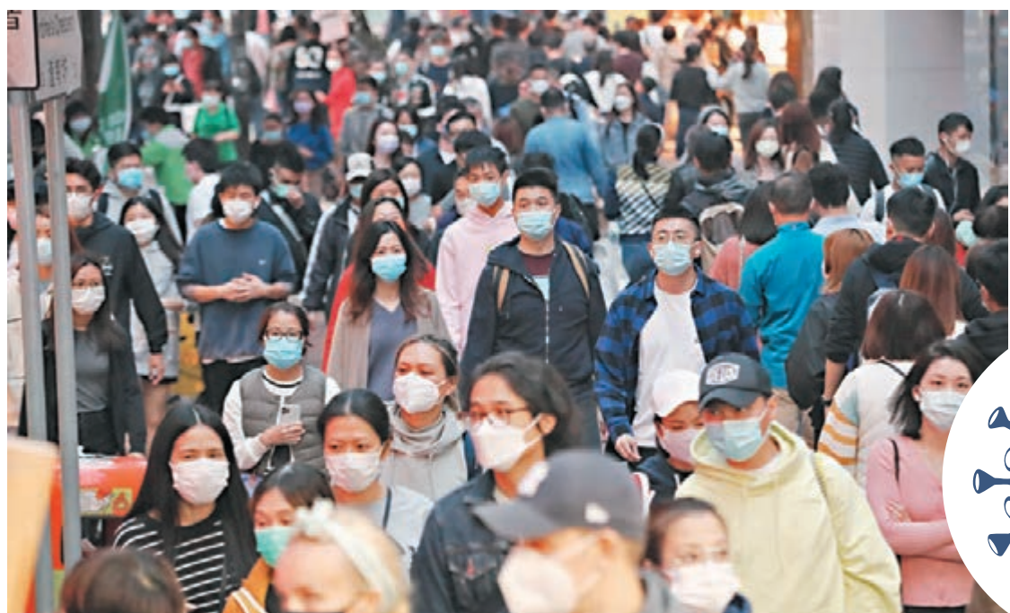
本港疫情嚴峻，但昨天周日銅鑼灣街頭仍人頭湧湧。