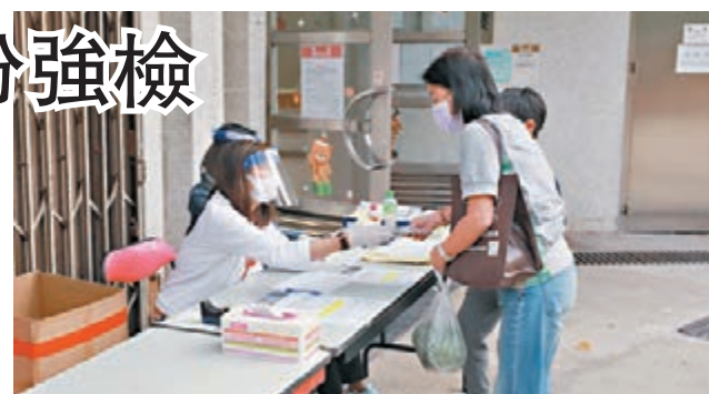
東頭邨貴東樓有7人確診，政府派樽。

一名高層單位住戶批評，大廈管理處清潔工作不到位，居民曾多次要求管理處在大堂放置有蓋的大型垃圾桶，但管