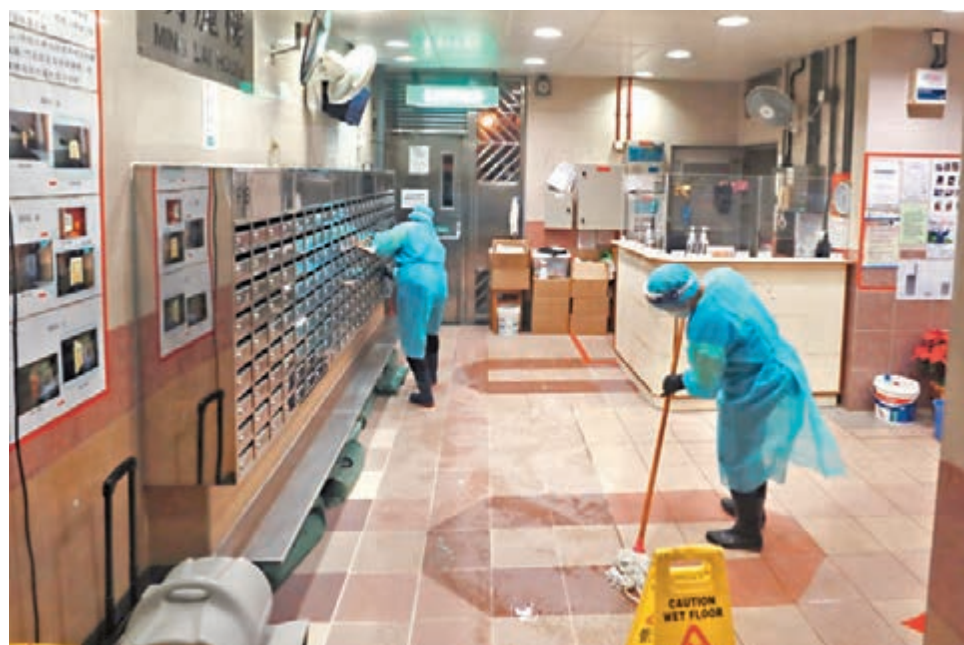
彩雲邨明麗樓3個單位有4人確診，昨晚對公眾地方進行清洗消毒。