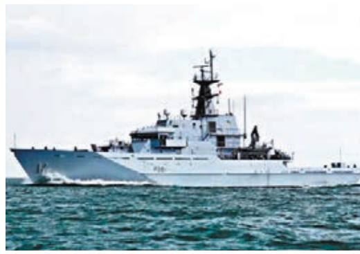
英國計劃一旦無協議脫歐，將自明年起派遣4艘巡邏艦保護英國水域，阻止歐盟國家的漁船闖入捕魚。

英國與歐盟的貿易談判期限今日屆滿，但雙方仍未能就捕魚權等議題達成共識，令磋商過程膠着，首相約翰遜前日主持內閣會議，商討無協議脫歐下的應對選項。據英國廣播公司(BBC)報道，英國政府計劃一旦在過渡期結束後無協議脫歐，將自明年起派遣4艘巡邏艦保護英國水域，阻止歐盟國家的漁船闖入捕魚。