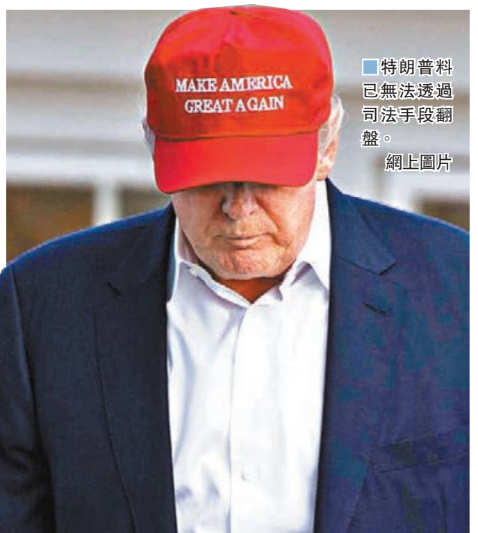
特朗普料已無法透過司法手段翻盤。