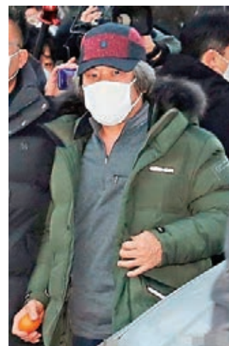
強姦犯趙斗淳昨日早上刑滿出獄。