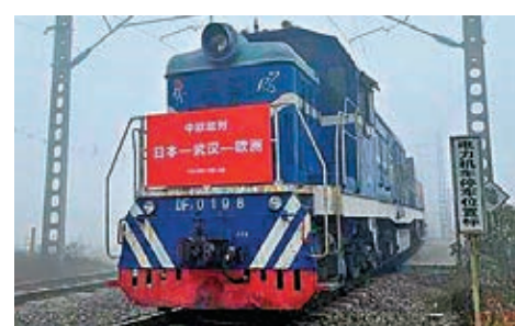
■ 日本商品首次借道武漢中轉歐洲。

武漢港航發展集團有限公司相關負責人介紹說，根據日方企業需求，公司和中外運湖北有限公司在相關企業和武漢海關的支持下，使日本貨物成功搭上中歐班列「快車」。與單純的海運相比，運輸時間將由50多天壓縮到20多天。