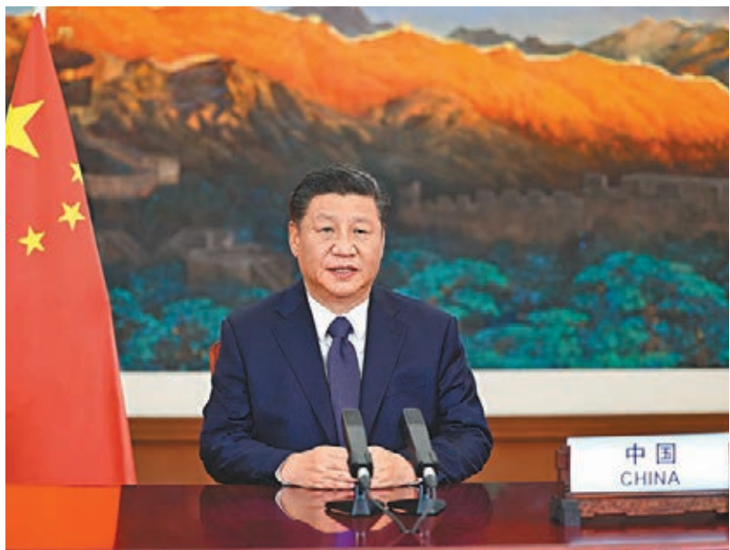
■ 習近平在氣候雄心峰會上發表重要講話。

香港文匯報訊 據新華社報道，國家主席習近平12日在氣候雄心峰會上通過視頻發表題為《繼往開來，開啟全球應對氣候變化新征程》的重要講話，宣布中國國家自主貢獻一系列新舉措。