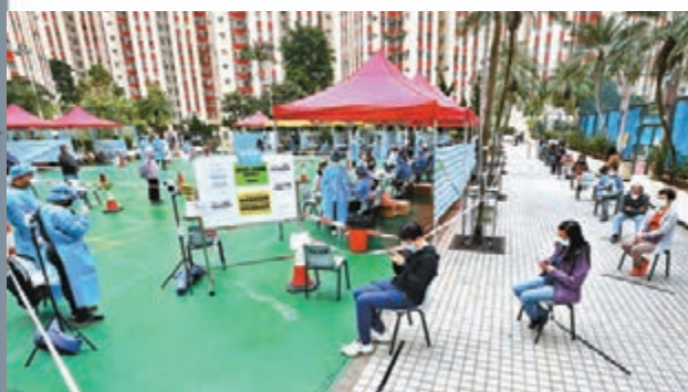
九龍灣麗晶花園第六座D室爆發，同座其他住戶須要強檢。圖為居民在麗晶臨時檢測站排隊輪候。

他又指，若曾將浴缸換成企缸，不少裝修師傅會改用其他配件做到「水封」作用，但未必符合規格，故勸喻市民若在廁所聞到臭味，須立即找合資格人士進行檢查和維修。