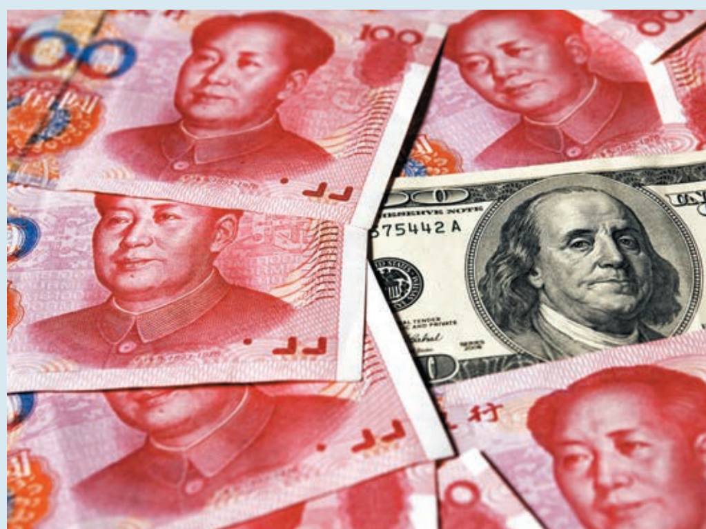
有分析員預期，人民幣兌美元明年會進一步升值，明年底人民幣兌美元目標為6.25。