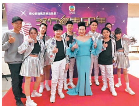
家燕姐對其藝術中心學生的健康相當著緊。

家燕姐坦言作為藝人，很多時因工作關係未能戴口罩，加上早前無錢再有員工確診新冠肺炎。