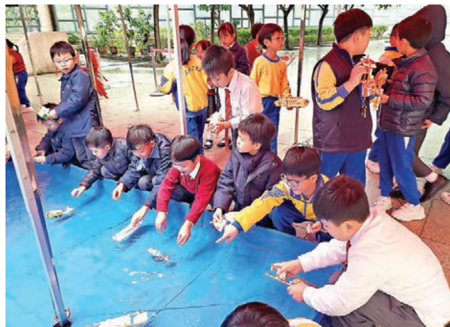
學生用「牛奶盒」製作紙盒船，利用水的產生反作用力使船移動。

我期望透過日常教學及不同類型的環保活動，讓學生及其家人明白人與大自然應和諧共處，使受造物得以延續，發揚校訓「愛化主民」的精神，惠澤全人類。