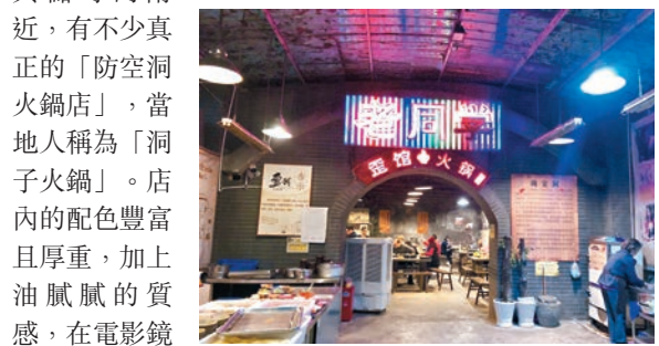
《火鍋英雄》將「防空洞火鍋」呈現於觀眾眼前

楊慶導演為觀眾呈現了屬於重慶的諸多特徵——防空洞火鍋、燈紅酒綠的江岸，以及犯罪動作片需要的高低錯落的空間，影片幾乎所有外景都取自重慶。防空洞是抗日戰爭時期，國民政府為了躲避日軍的轟炸，依託山城特色在重慶修建的人工洞穴。防空洞內部幽暗狹長，成為後人夏日貪涼的絕佳去處，也有不少商家利用防空洞「天然空調」的優勢經營起火鍋店。在渝中區兩路口與儲奇門附近，有不少真正的「防空洞火鍋店」，當地人稱為「洞子火鍋」。店內的配色豐富且厚重，加上油膩膩的質感，在電影鏡頭中顯得輕鬆而詭異。