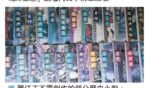
麗江王丕震創作的部分歷史小說。