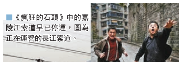
《瘋狂的石頭》劇照，拍攝地為重慶渝中區羅漢寺附近。

作為在重慶市中心取景最著名的影片之一，電影故事的開頭，謝小盟勾搭姑娘的轎車是重慶嘉陵江索道，不過嘉陵江索道已經在2011年停運，兩年後拆除，但長江索道仍在運營，成為當地最有名的觀光打卡地。影片主要取景地除了重慶長江索道外，就是渝中區羅漢寺片區：這哥第一次偷翡翠的追擊戰就是在寺內發生的，後來黑皮從下水道裏爬出來，也是羅漢寺附近。