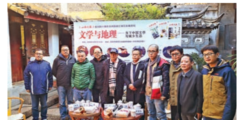
舉辦「文學與地理——當下中國文學與城鄉生態」論壇向文學前輩致敬。