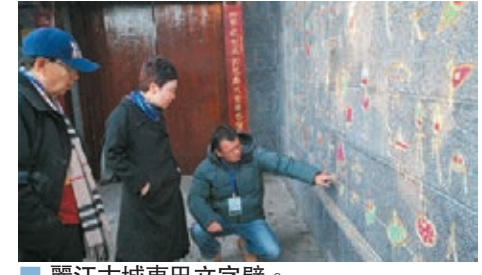
麗江古城東巴文字壁。