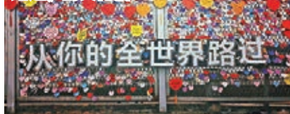
鵝嶺二廠現成為文創區

鵝嶺二廠的天台，是張一白電影中陳末工作的天台，是陳末、幺幺、小容三人戀情故事關鍵情節的發生地，如今已經開放遊覽，需要花費20元門票，這裏可以從獨特的老山城角度俯瞰重慶全貌。在飽經滄桑的廢棄廠房上重建工業風格建築，結合各種藝術感的現代元素，加上「愛情天台」電影濾鏡加持，鵝嶺二廠已經成為當地非去不可的打卡地。