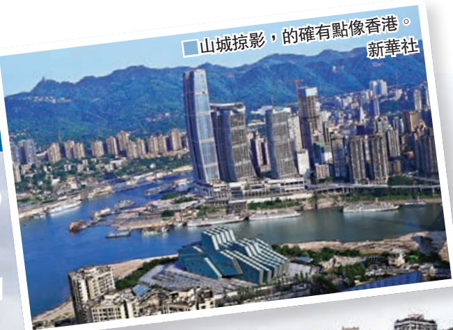
重慶因高低錯落的地勢，依山而起的摩天大樓，成為影視拍攝新寵。

在今年香港電影金像獎評選中，《少年的你》豪攬最佳影片、最佳導演等8項大獎；《花椒之味》獲最佳女主角提名，這兩部電影皆在山城重慶取景拍攝。自《瘋狂的石頭》起，山城重慶在影視鏡頭中頻頻出現，其高低錯落的地勢，依山而起的摩天大樓，號稱立體版都市迷宮的重慶，從視覺上就賦予了影片高衝突度的場景設定，繼香港後，山城重慶成為影視拍攝新寵，當中不少電影中的景點更成為遊客熱門打卡地。