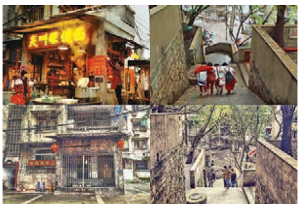
《風犬少年的天空》劇照與拍攝地實景對比。

今年10月，網劇《風犬少年的天空》頻頻登上热搜，這部由張一白、韓琰、李炳強執導，里則林擔任編劇，彭昱暢主演的青春劇，被譽為中國版「請回答1988」。該劇講述了千禧年間一群出身不同性格各異的少年們，在純真校園與社會現實的衝突中向陽奔跑，大家一起跌跌撞撞的成長時光。這部劇的取景地是山城重慶，大興村居民樓、重慶第29中學等重慶人每天都經過的地方，隨着這部劇的熱播，正在成為新一波的網紅打卡地。