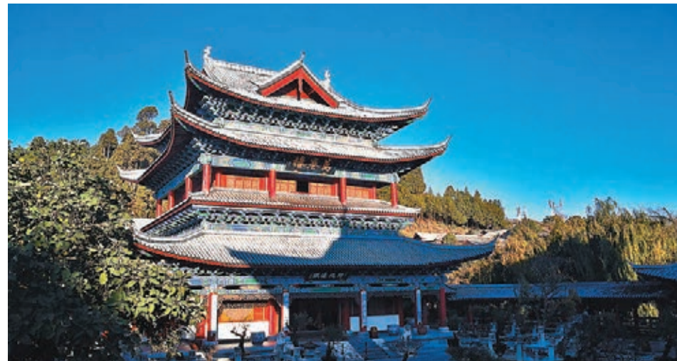
麗江木府萬卷樓位於中軸線議事廳，顯示土司重視漢文化的學習。

香港導演對於城市空間調度頗有情緒，而重慶恰恰擁有這樣的天賦。影片中，處處充滿高地起伏；陡峭無邊的階梯側面烘托了人物命運開始發生無法迴旋的轉折。立交橋下是男主角小北的家，陳念上學要乘坐皇冠大扶梯，一下一上；陳念在筒子樓中被欺凌追逐。雖是發生在重慶的故事，但搖晃的俯仰鏡頭，讓人不由得聯想起香港電影中的城市空間。