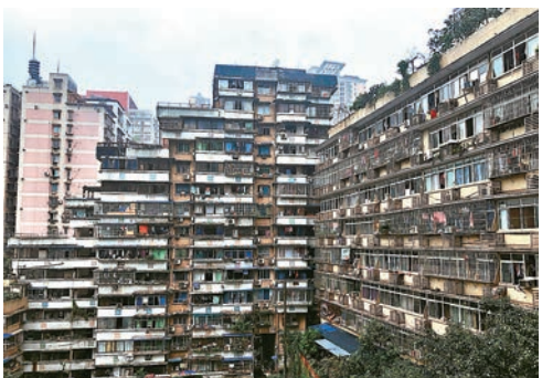
24層高卻沒有電梯的魔幻網紅建築白象居

在繁華鬧市中，有一座上世紀90年代初建成的高層住宅群「白象居」，24層高卻沒有電梯，破敗簡陋的房屋與對面的繁華喜來登對比鮮明——讓人感覺賽博朋克的「白象居」，成為重慶這座魔幻之城中最為隱秘的傳奇建築之一。《火鍋英雄》、《少年的你》、《風犬少年的天空》皆在此取景。