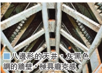
八邊形的天井，灰黑色調的牆壁，極具龐克感。

海棠溪筒子樓曾經是一線江景房，筒子樓分兩棟，共13層，主要入口位於第七層，《少年的你》女主角陳念便是經過7層的走廊日常進出，電影中的樓層過道張貼滿了催賬單，現實中也是如此。八邊形的天井，灰黑色調的牆壁，老舊的Z字樓梯，這棟建築兼具年代感與現代龐克元素。