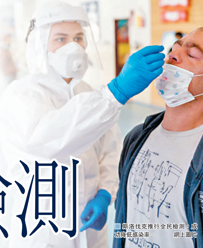
斯洛伐克推行全民檢測，成功降低感染率。網上圖片