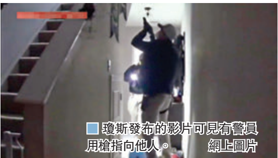
瓊斯發布的影片可見有警員用槍指向他人。

有人非法存取州政府的衛生緊急警報系統數據，故展開調查，警方根據IP地址鎖定瓊斯，前日持搜查令搜查其住所。據媒體報道，上月有人透過緊急警報系統，在未經授權下向近1,800名衛生部員工發短訊，鼓勵他們「在另外1.7萬人死亡前發聲」。