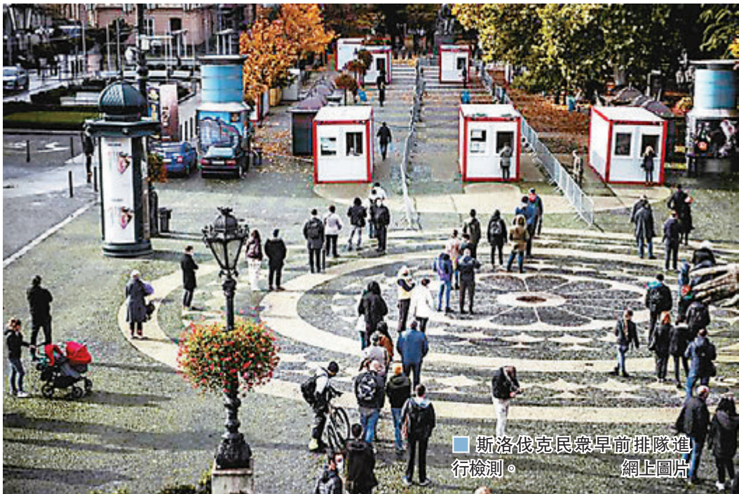
斯洛伐克民眾早前排隊進行檢測。網上圖片