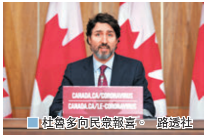
杜魯多向民眾報喜。