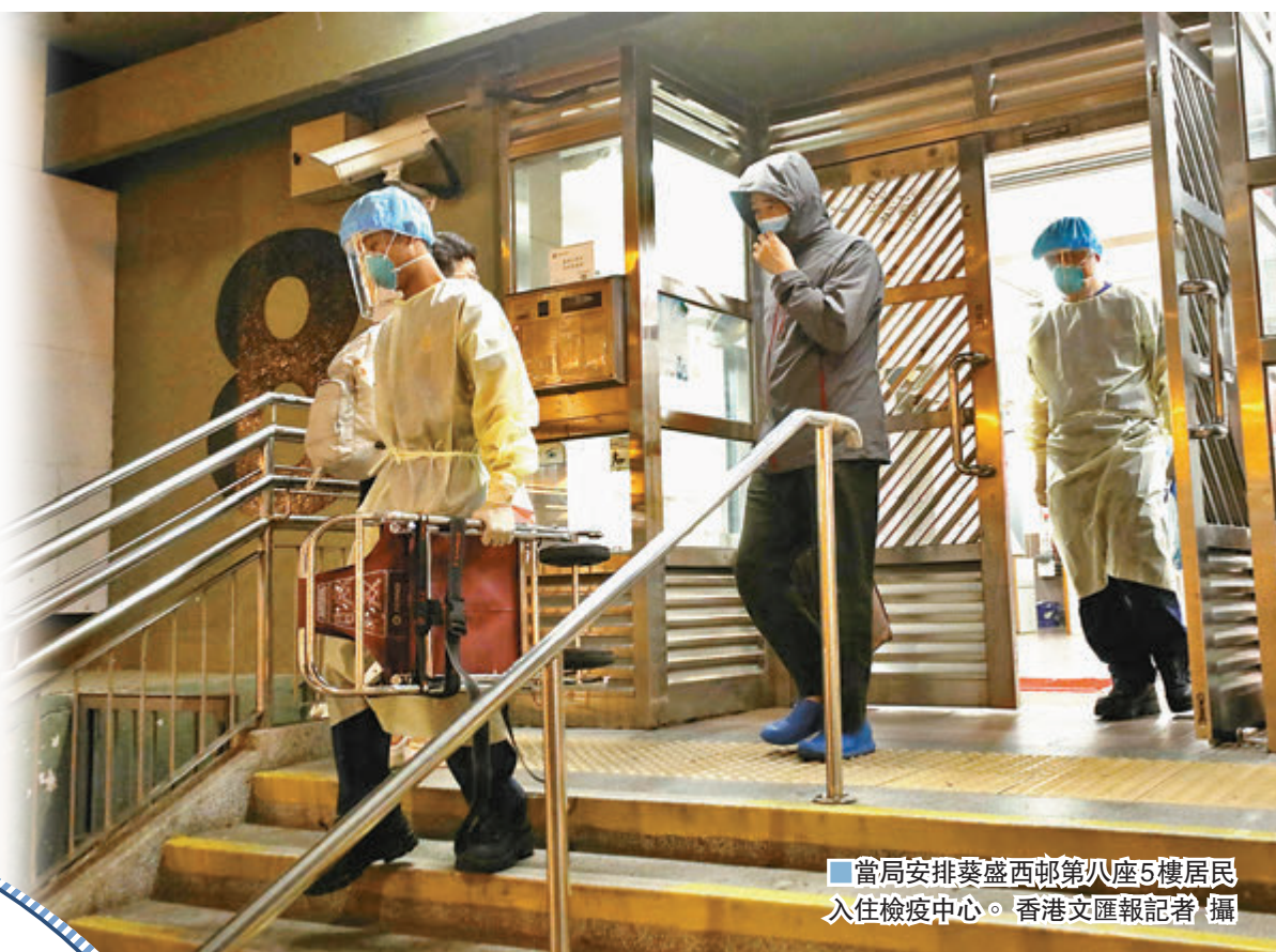
當局安排葵盛西邨第八座5樓居民 入住檢疫中心。

再次「破百」達100宗，累計確診個案衝破7,000宗，葵盛西邨再多9名住戶確診或初步確診。為防疫情進一步惡化，特區政府昨日宣布收緊一系列防疫措施，同時已修訂防疫規例，為「禁足令」制定明確的法律框架。一旦發現某些處所出現集體感染爆發情況，並經衛生署評估傳播風險後，可按需要發出「限制與檢測宣告」，要求相關人士強制進行檢測，並於全部檢測結果出爐前，必須「禁足」留在指定處所等候結果，「禁足令」最長為期7天，其間社署及民政事務總署會為受影響市民提供日常必需品及食物。政府昨晚已就《預防及控制疾病（對若干人士強制檢測）規例》（《規例》）（第599J章）下的最新法例修訂刊憲。 ■香港文匯報記者 成祖明