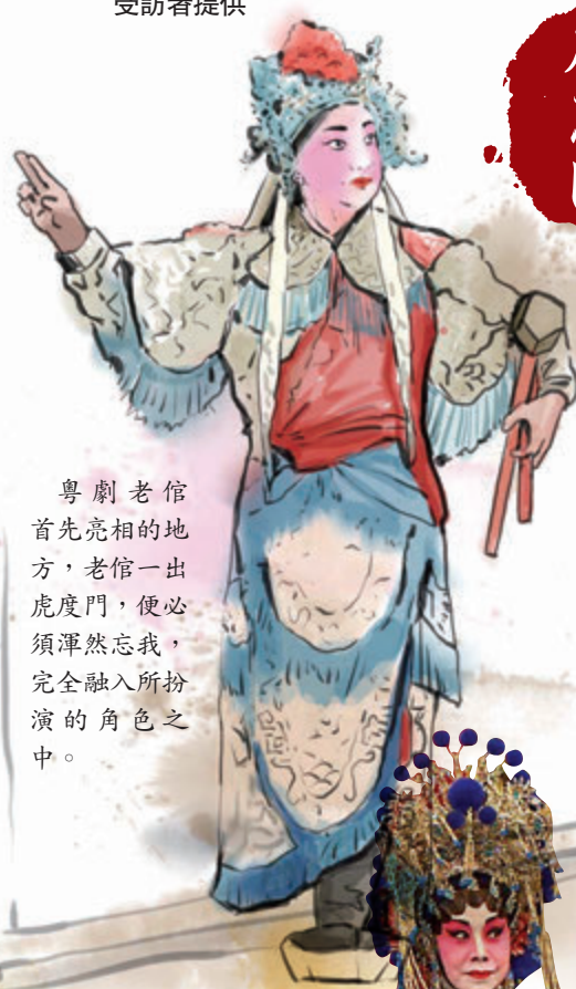
粵劇老倌首先亮相的地方，老倌一出虎度門，便必須渾然忘我，完全融入所扮演的角色之中。