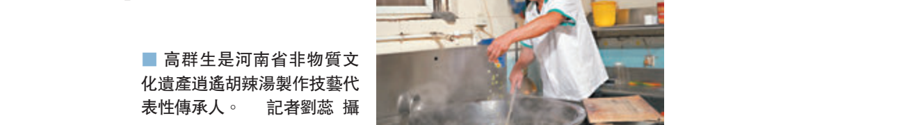
■ 高群生是河南省非物質文化遺產逍遙胡辣湯製作技藝代表性傳承人。