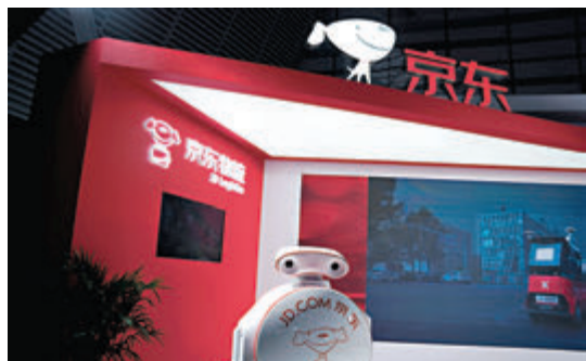
■ 京東是試點中首個接入數字人民幣的電商。

京東集團(9618)旗下金融科技子公司——京東數科前日在其官方公眾號稱，此次試點支持在京東商城購物時