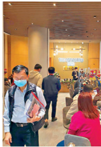
■ 消息指長沙灣雅麗收近200票，超額登記逾5倍。

疫情下，聖誕節及新年假期市民繼續暫緩外遊，留港消費，港置行政總裁李志成相信，這有利12月樓市交投。該行十大屋苑剛過去周末兩日合共錄7宗，按周增加1宗。此外，美聯過去兩日錄得20宗成交，為連續第18個周末錄得雙位數水平，創6個周末新高，按周增加5宗。