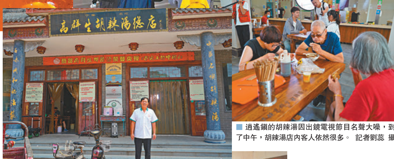
■ 河南省周口市西華縣逍遙鎮的胡辣湯店成為「美食打卡地」。