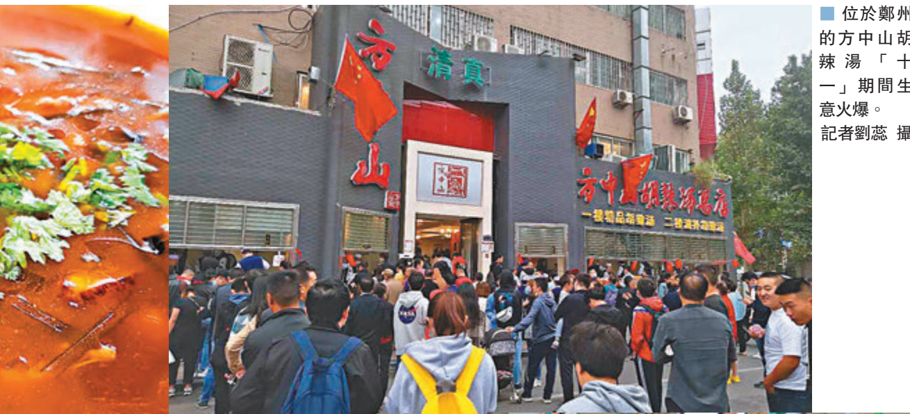
■ 位於鄭州的方中山胡辣湯「十一」期間生意火爆。