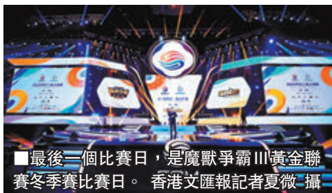
■最後一個比賽日，是魔獸爭霸III黃金聯賽冬季賽比賽日。

數千萬人次線上觀賽 電競上海大師賽落幕 香港文匯報訊（記者 夏微 上海報導）6日，2020電競上海大師賽最後一個比賽日是魔獸爭霸III黃金聯賽冬季賽的比賽日。半決賽一場是中國選手對決，一場是韓國選手內戰，而隨後進行的大師賽收官戰，則是一場線上線下同步進行的中韓巔峰對決。疫情下，兩位中國選手經核酸檢測後現場參賽，兩位韓國選手則在線上參賽。 為期五天的電競上海大師賽是2020年上海電競收場的大型賽事，今年雖然因為疫情，線下觀眾數量受限，但線上平台卻力度空前。賽事全程線上觀賽人次超過4,000萬，單是平台峰值觀看人次已超過220萬。