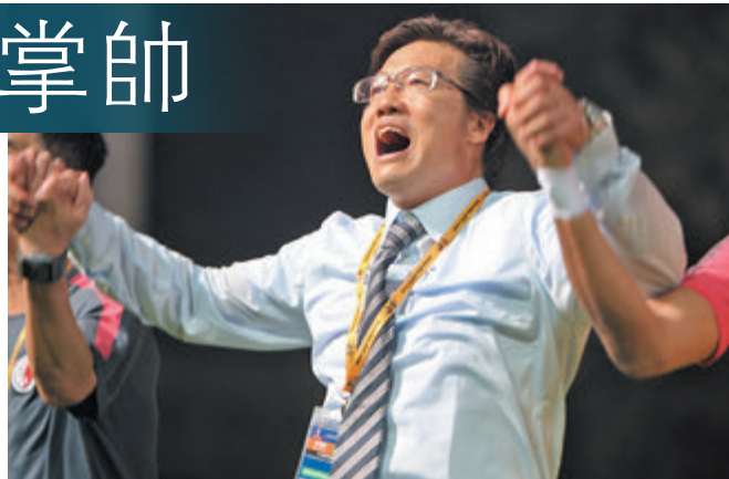
■金判坤曾帶領港足取得佳績。

金判坤除了擔任韓國足總技術總監，也身兼足總副主席一職，一時間要求他放下要職重執教鞭，恐怕並非易事。有消息指，中超球會為請他出山，會出盡甘詞厚幣，並打算提出100萬美元年薪，利誘金判坤加盟，至於這位與香港球壇頗有淵源的功勳教練，會否因此動搖則屬後話。