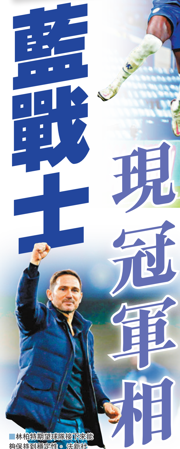
■林柏特期望球隊接下來能夠保持到穩定性。