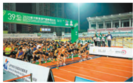
■「2020銀河娛樂澳門國際馬拉松」圓滿結束。

雖受疫情陰影籠罩，今屆報名反應依然熱烈，名額迅速爆滿。為了向所有參賽者提供安全、健康的賽事環境，所有參賽者須於出賽前通過核酸測試，進場前亦需接受體溫檢測及出示「澳門健康碼」方可參賽，觀眾及工作人員亦需佩戴口罩及遵守相關防疫措施。賽事設有馬拉松、半程馬拉松及迷你馬拉松，路線途經多個著名景點，最終董國建及張