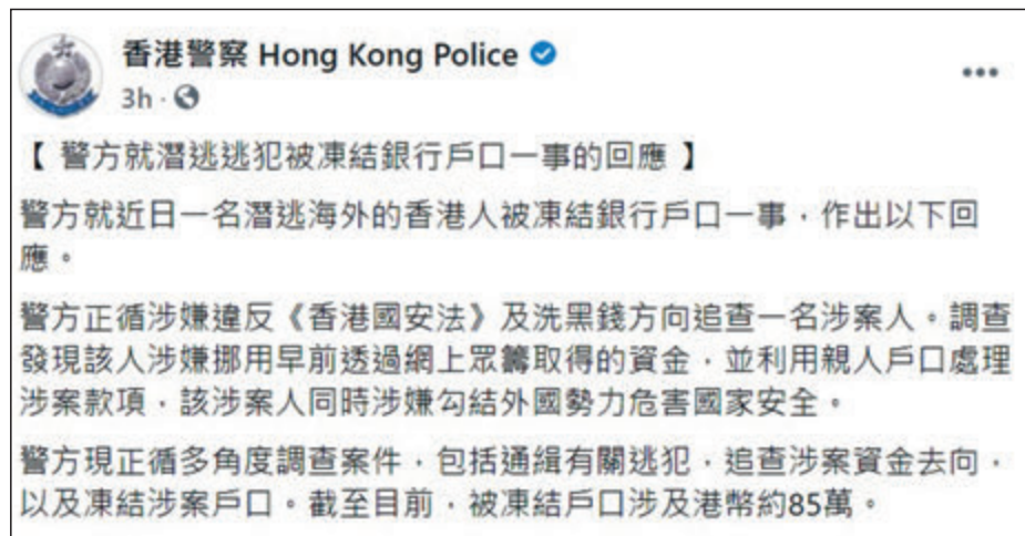
警方就逃犯潛逃被凍結銀行戶口說明情況。