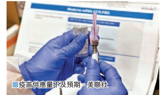
疫苗供應量不及預期。