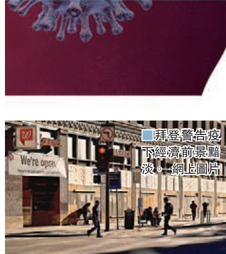
拜登警告疫下經濟前景黯淡。