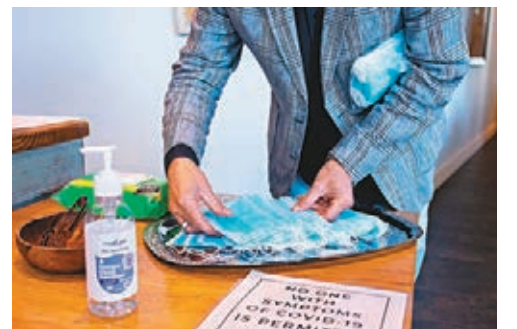
佐治亞州有餐廳準備搓手液和口罩。