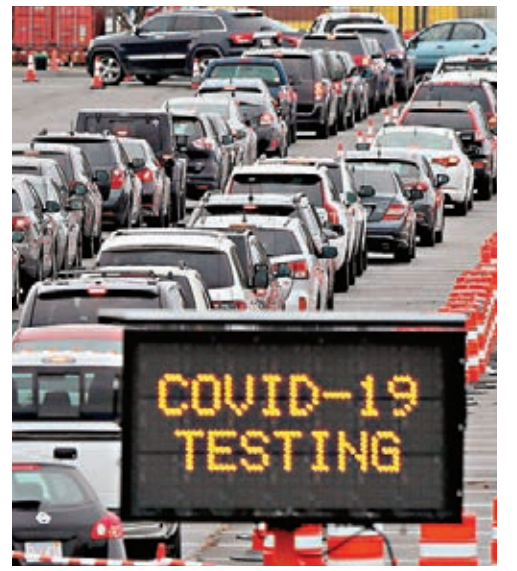
疫情擴散，麻省檢測站大排長龍。

CDC前日則發布新指引中，指出考慮到入冬後天氣轉冷，呼籲民眾減少外出，並在住所以外的室內場所佩戴口罩。CDC強調，近期研究顯示約半數染疫患者，是被無病徵人士傳染，因此在室內無法保持約2米社交距離時，持續佩戴口罩是抗疫關鍵。CDC還提醒若家中有確診者或密切接觸者，同住者亦要佩戴口罩。