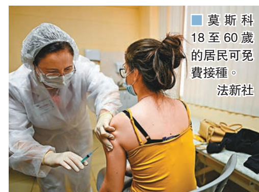
莫斯科18至60歲的居民可免費接種。

俄羅斯昨日正式展開新冠肺炎疫苗大規模接種，首先從疫情最嚴峻的首都莫斯科開始，俄羅斯自行研發的新冠疫苗「史沃尼克5」號已分發至市內70間診所，醫護人員、教師、社工等有機會與病人接觸的高危人士可優先接種，為全球首個公開讓國民大規