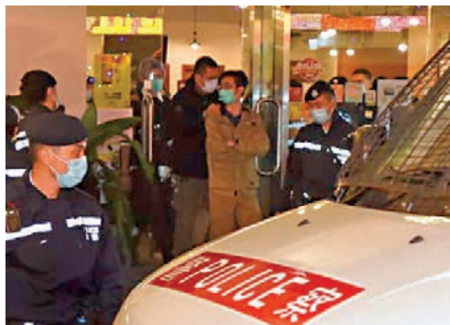
桔梗餐廳負責人被捕。