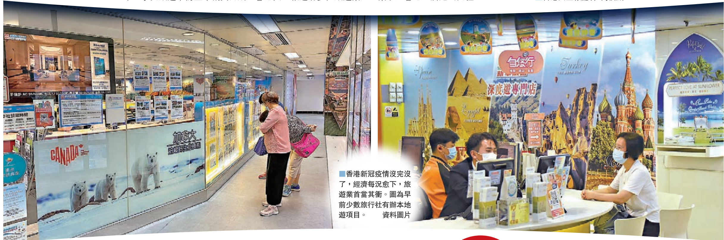
香港新冠疫情沒完沒了，經濟每況愈下，旅遊業首當其衝。圖為早前少數旅行社有辦本地遊項目。資料圖片