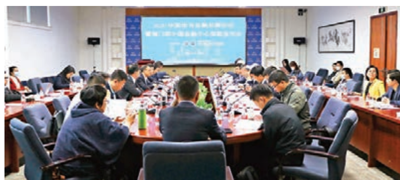
全國金融中心排名滬京深居前三名，深圳近三年增金融人才達10%，圖為發布會現場。

香港文匯報訊(記者 李昌鴻 深圳報導)由中國(深圳)綜合開發研究院編制的第十二期「中國金融中心指數(CDI-CFCI)」昨在深圳發布，上海、北京、深圳分列全國金融中心前三甲，廣州、杭州、成都、天津等進入區域金融中心十強。因大力吸引人才奏效，深圳近三年金融人才每年增長10%。