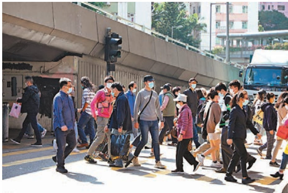
駿隆強積金綜合指數升6.1%至249點。三大主要指數有不同程度升幅，其中股票基金指數升8.5%至347點，表現最好。