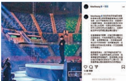
歌手張敬軒得悉有觀眾感染新冠病毒後，在社交平台表示感到非常擔憂和難過。IG截圖