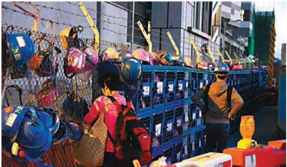
本港新增112宗新冠肺炎確診個案，其中日出康城9期地盤群組再增5名工人及兩名員工家屬。圖為「日出康城」工地。

至合共32人，包括27名員工及5名家屬。其餘確診個案包括兩名學生，分別就讀竹園五旬節聖潔會永光書院及西灣河香港中國婦女會中學，張竹君指兩間學校師生均獲安排檢測，而昨日亦再有的士司機證實染疫，其所駕的士車牌號碼為VF4177。 衛生防護中心傳染病處主任張竹君指出，現時確診人數仍然上升，不明源頭個案亦高於前日，暫未見到疫情有任何向下趨勢。 另外，海關昨晚公布，北角海關總部大樓職員食堂一名女收銀員初步確診，她本週二(1日)最後上班，前日(3日)身體不適往醫院求醫後確診。因應政府本週三(2日)起實施的僱員特別上班安排，該食堂已於同日起暫停營業。 漁護署發言人昨晚則表示，一隻混種短毛貓亦對新冠病毒呈陽性反應。該隻短毛貓與畜養人居於東涌，其畜養人為確診個案的密切接觸者，貓隻本週二被送到漁護署檢疫，該署會繼續為該貓隻進行密切監察及反覆測試。