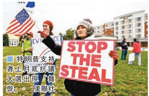
■ 特朗普支持者上月底抗議大選出現「舞弊」。

事實：賓州沒有任何監票員被禁進入點票中心，特朗普競選團隊律師也承認，賓州票站有共和黨監票員在場。