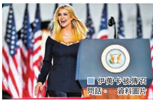
■ 伊萬卡被傳召問話。

美國總統特朗普為2017年就職典禮成立一個非牟利性質的委員會，但委員會被指控挪用款項，令特朗普家族獲利逾100萬美元(約775萬