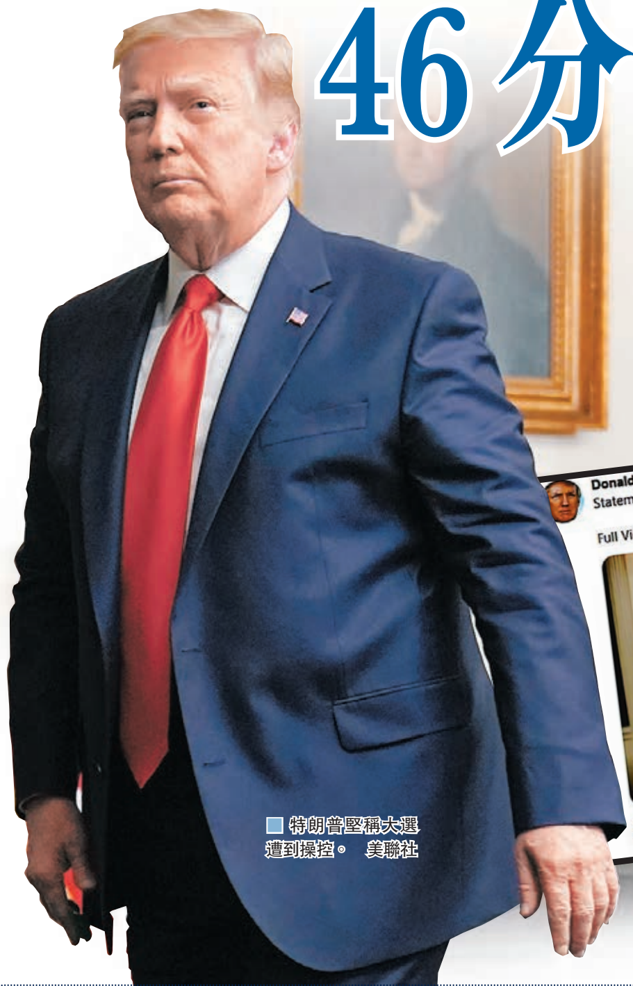
■ 特朗普堅稱大選遭到操控。