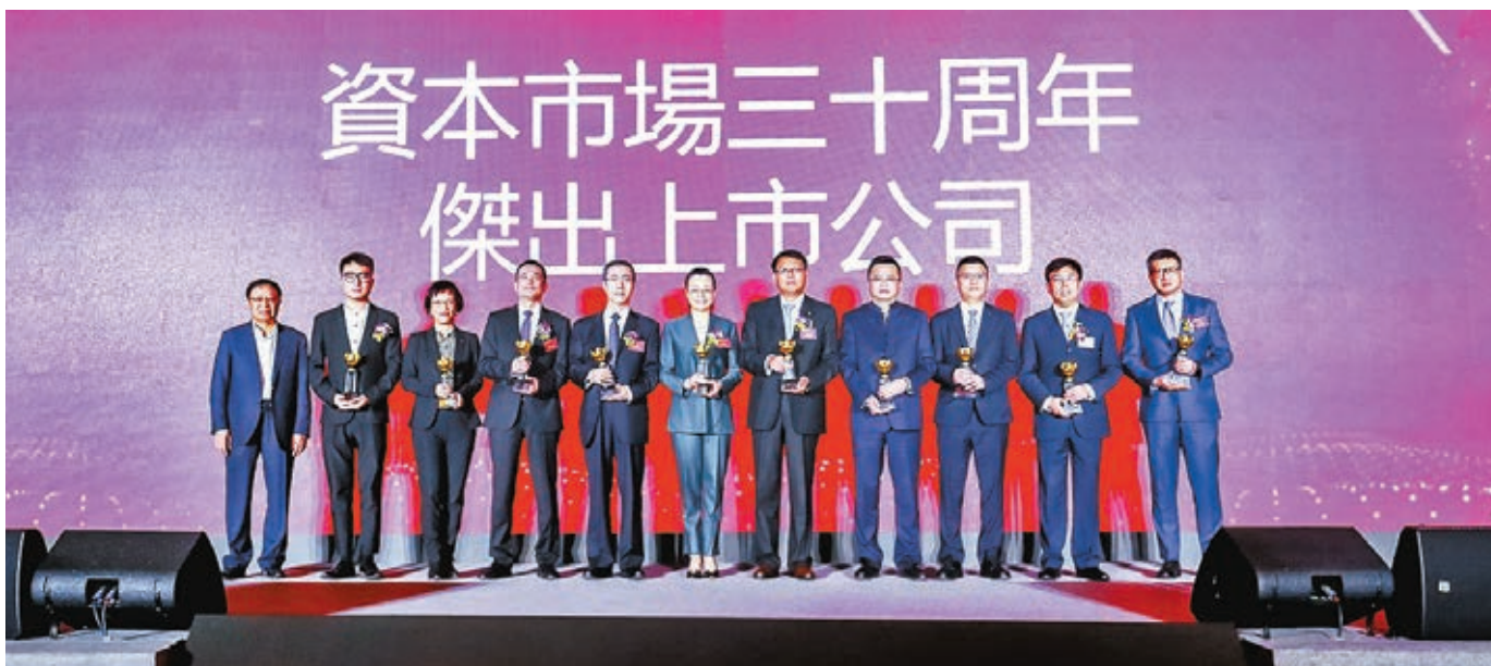
第十屆中國證券金紫荊獎昨日順利舉行。當中奪得「資本市場三十周年傑出上市公司」獎的有中國石油天然氣股份有限公司、中國石油化工有限公司、中國神華能源股份有限公司等等。

中銀國際證券股份有限公司 交銀國際控股有限公司 農銀國際控股有限公司 建銀國際(控股)有限公司 中泰金融國際有限公司 興證國際金融集團有限公司 華泰國際金融控股有限公司 浦銀國際控股有限公司 招銀國際金融有限公司 東證國際金融集團有限公司