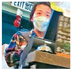
「安心出行」二維碼含糊黃店店員對會否張貼

政府消息人士表示，申請「安心出行」二維碼手續簡單，根本毋須等待，網上申請即時獲取二維碼，即可