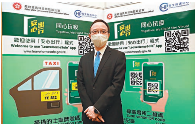
政府資訊科技總監林偉喬。

香港文匯報訊(記者 聶曉輝)特区政府於上月中推出「安心出行」感染風險通知App，但一直被攪炒派造謠指有關程式過量地搜集用家個人資料，甚至是政府作為監控市民行蹤的工具云云。政府資訊科技總監林偉喬昨日再度澄清，程式所需權限僅是為了令程式暢順運作，絕不涉及侵犯私隱，但為了釋除公眾疑慮，已於日前取消了USB儲存及相片及查看Wi-Fi連接的權限。他並指，稍後會提升程式的部分功能，包括用家可查閱自己的個人出行記錄等。