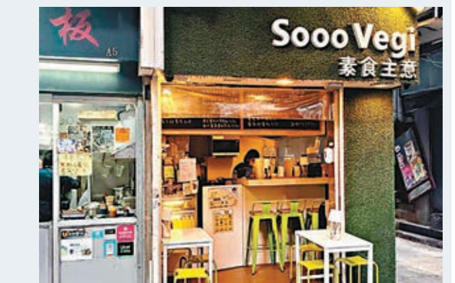
多間黃店食肆沒有張貼「安心出行」二維碼。