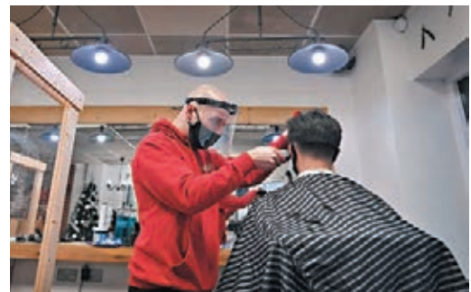
英格蘭結束封城，有髮型屋一早開始營業。