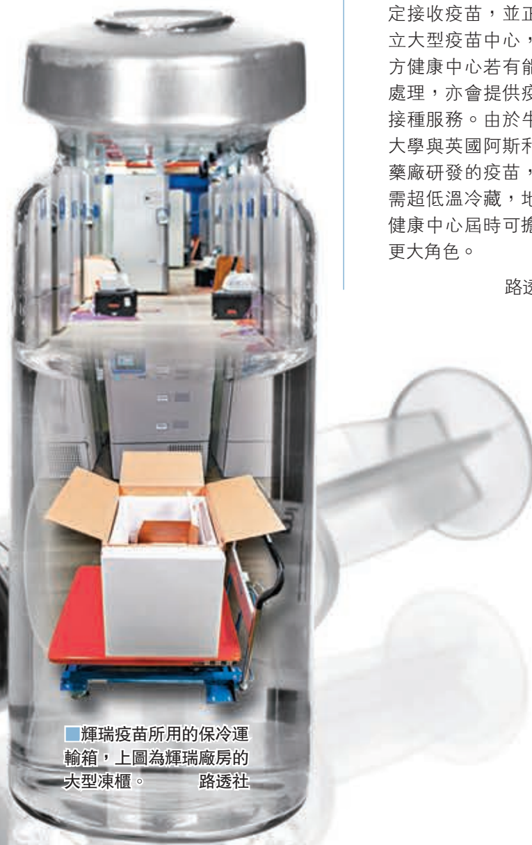
輝瑞疫苗所用的保冷運輸箱，上圖為輝瑞藥廠的大型凍櫃。