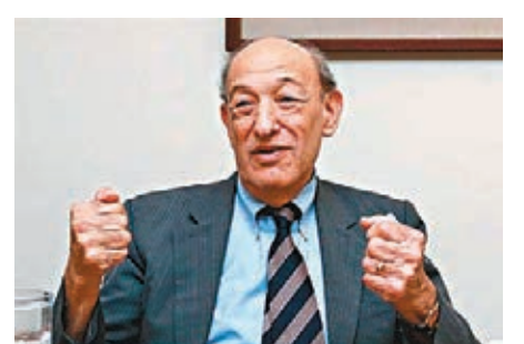
美國哈佛大學榮休教授傅高義。

傅高義是美國知名中國問題專家，這是他首次參加香山論壇。傅高義表示，目前中美關係處於歷史低谷，這對兩個國家都是不利的。他認為，美國的一些政治家非常反華，他們對新疆、西藏和香港問題進行批評，但拜登為中美關係帶來了一個機會。「我認為我們需要高層、專業人士以及工作層三個層次作出努力，盡快推動美中兩國高層會晤、專業人士進行專業應對，工作層則在細節方面進行溝通。」傅高義也表示，美國不應該詆毀中國在世界範圍內所作的建設性努力，比如中國在節節減排、在非洲國家基礎設施建設、抗擊疫情等方面作出的貢獻，美國應該承認中國對世界的貢獻，公平地對待中國。