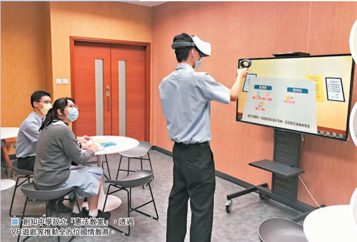
創知中學設立「憲法教室」，透過VR遊戲等推動全方位國情教育。