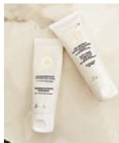
■ 蜂蜜潔手啫喱同蜂蜜潤手霜

今次，全新殿堂級蜂皇蜂蜜潔手啫喱同蜂蜜潤手霜護手仔寶，承傳 Guerlain 着重清潔衛生之餘，呵護每一吋肌膚，用心傳遞每一份心意。品牌全新潔手啫喱，其配方蘊含蜂蜜精華、70%酒精和甘醇(glycol)，徹底潔淨手部之餘，同時可滋潤肌膚，最後使用蜂蜜潤手霜，可作為聖誕禮物之選，並成為冬日護手必備仔寶。