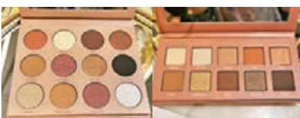
■ 眼影顏色以不同城市及心情表示

隨着聖誕的腳步趨近，今年正式登陸香港的瑞典彩妝品牌 CAIA COSMETICS ASIA 也推出了兩款神秘禮盒，與大家一起共度佳節。在聖誕神秘禮盒中，品牌為大家精選了數款高CP值及高人氣的貨裝產品，當中不乏皇牌眼影盤、修容盤、化妝掃及唇彩等。聖誕神秘禮盒將於12月4至25日限量在官方網站發售，讓大家可以動人妝容慶祝聖誕佳節，締造珍貴夢幻的節日回憶。今次全新推出的兩款聖誕神秘禮盒，包括4款HK$630或8款HK$920暢銷且適合亞洲女生的眼影盤、修容盤及唇膏等驚喜彩妝產品，當中所有產品均是貨裝，價錢