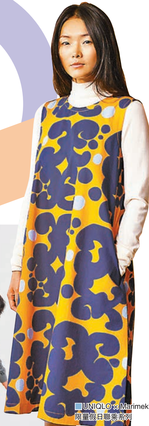
UNIQLO x Marimekko 限量假日聯乘系列