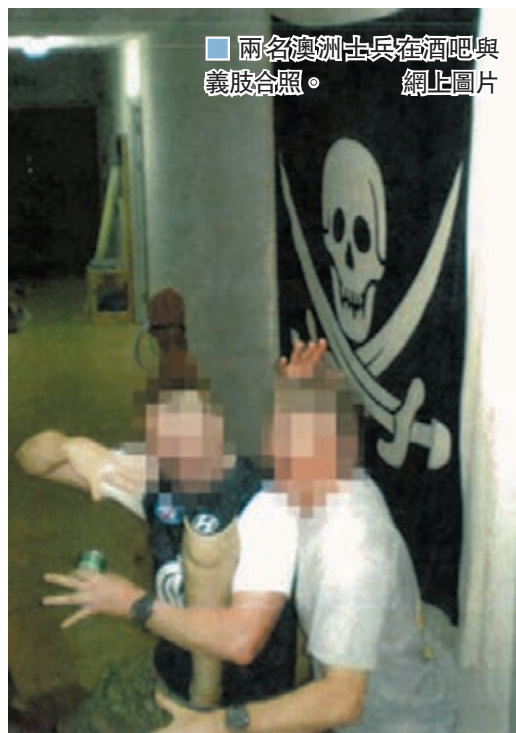
兩名澳洲士兵在酒吧與義肢合照。