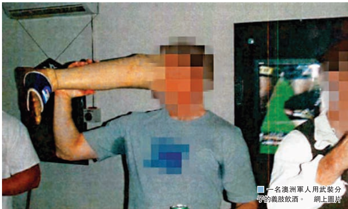
一名澳洲軍人用武裝分子的義肢飲酒。