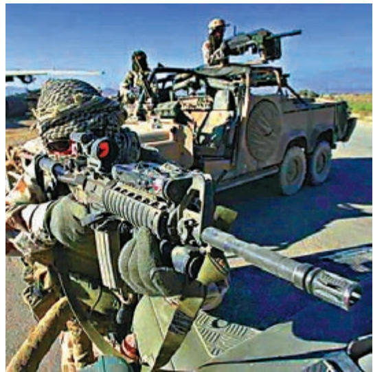
澳洲特種部隊所作令人髮指。網上圖片

英國《衛報》昨日刊出多張相片，顯示一名澳洲特種部隊士兵在阿富汗一間酒吧中，用一名被殺的塔利班士兵的義肢當作酒杯，裝啤酒暢飲，還有兩名士兵拿着義肢跳舞。此前曾有傳媒報道，澳洲高級軍官曾使用士兵義肢裝酒飲用，今次公開刊登的相片，是首次證實有關報道內容。