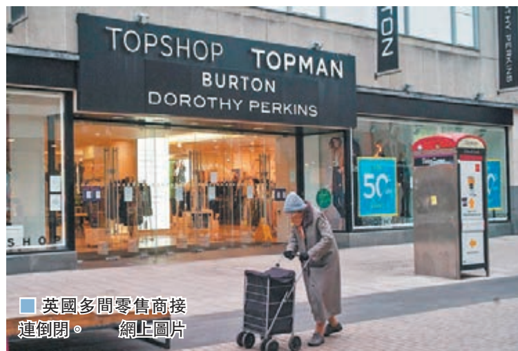
英國多間零售店接連倒閉。網上圖片

英國大型時尚服裝集團Arcadia前日發布公告，宣布正式進入清盤破產程序，成為在新冠疫情爆發至今，宣布破產的英國最大型企業，集團在全球的1.3萬名員工或被遣散。Arcadia發聲明稱，疫情重創英國零售市場，集團主力經營實體購物，業務更大受打擊。