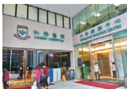
仁安醫院休息室或出現小型爆發。 資料圖片

香港文匯報訊 (記者 唐文) 本港再有醫護人員確診感染新冠病毒，伊利沙伯醫院化驗室一名醫生前日初步確診後，另一名同在化驗室工作的醫生昨日確診，但兩名醫生在工作中未有接觸病人和新冠病毒樣本，故疑是在社區感染。此外，仁安醫院醫療造影部10日內有5人染疫，衛生防護中心調查後認為該院的休息室屬高危險點，或出現小型爆發，現約有50名使用休息室的職員已被隔離，等候檢測結果。