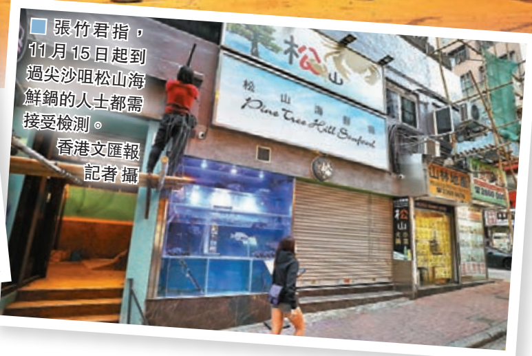
張竹君指，11月15日起到過尖沙咀松山海鮮鍋的人士都需接受檢測。

衛生防護中心傳染病處主任張竹君昨日在疫情簡報會上表示，新增的82宗確診個案，有10宗為輸入病例，其餘72宗本地個案中，23宗屬源頭不明，另有超過60宗初步確診個案。