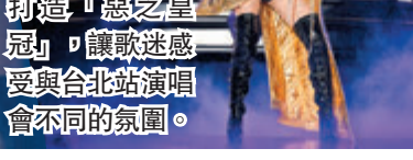
蔡依林斥資打造「惡之皇冠」，讓歌迷感受與台北站演唱會不同的氛圍。