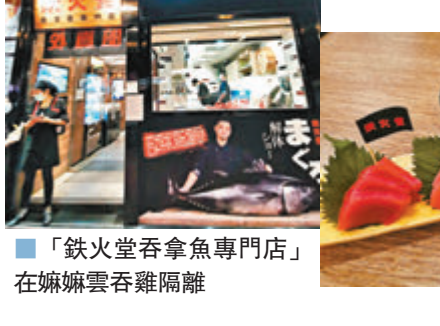
「鐵火堂吞拿魚專門店」在嫵嫵雲吞雞隔鄰

專門店十分注重衛生，料理師傅在處理食物前，均使用日本食用級消毒噴霧消毒餐具及盛載器皿，提高餐廳衛生及安全水平，