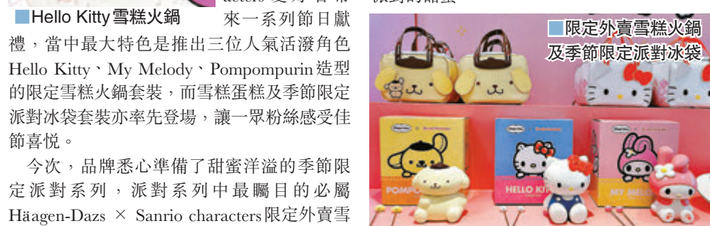
限定外賣雪糕火鍋及季節限定派對冰袋

現凡於12月14日或之前使用DBS信用卡預訂可享9折早鳥優惠，外賣雪糕火鍋換領更提供付費送貨服務選擇，讓你足不出戶已可享受派對的甜蜜。