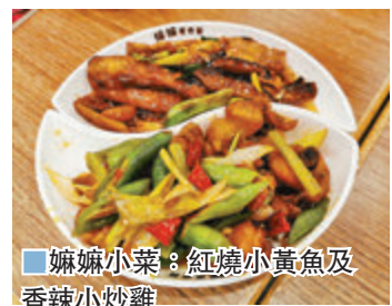
嫵嫵小菜：紅燒小黃魚及香辣小炒雞

在眾多菜式中，嫵嫵水蒸系列及嫵嫵家鄉酸菜系列最為吸引，嫵嫵水蒸系列包羅了川味水蒸魚、川味水蒸牛肉、川味水蒸羊肉及川味水蒸滑雞，而嫵嫵家鄉酸菜系列則包羅了家鄉酸菜魚、酸菜煮牛肉、酸菜煮滑雞、酸菜炒牛肉等，同樣有全份及半份選擇，而筆者所選的川味水蒸牛肉及家鄉酸菜魚是半份，上枱後如同一般餐廳的全份，經濟實惠。