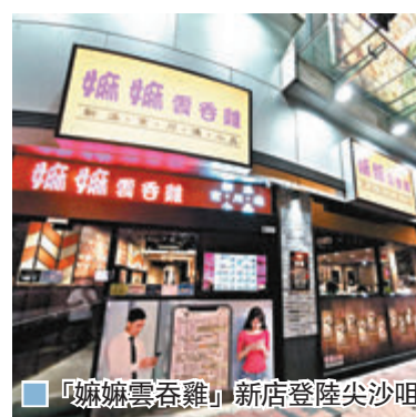
「嫵嫵雲吞雞」新店登陸尖沙咀