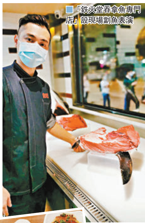
「鐵火堂吞拿魚專門店」設現場割魚表演

近日，在尖沙咀漆咸道有兩間新店，由同一老闆經營，分別是主打京、川、滬菜的「嫵嫵雲吞雞」新店，最大特色是餐廳特別推出小菜可選擇半份或全份，務求令食客以相同價格，享受到雙倍款式食物，同時，晚市的足料滋補燉湯，為港人帶來全新的舌尖享受。就在「嫵嫵雲吞雞」隔壁，「鐵火堂吞拿魚專門店」亦相繼開業，還特設現場割魚表演，吞拿魚愛好者不能錯過！