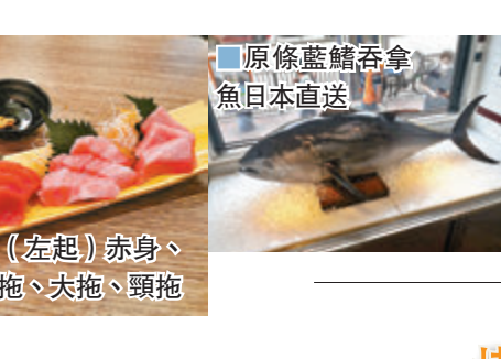
原條藍鯧吞拿魚日本直送 (左起) 赤身、中拖、大拖、頸拖

藍鯧吞拿魚幾乎每個部位都可以食用，大家知道可食用又珍貴的有幾個部位？腦天是吞拿魚頭頂部位的肉，多脂肪少筋，口感軟滑，一條魚只有少量，十分珍貴。而頸拖羅是吞拿魚頸部位的肉，非常肥美，入口即融。這些部位在一般的日式料理餐廳不容易吃到，大家可在專門店盡情品嚐藍鯧吞拿魚的精髓。