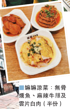
嫵嫵涼菜：無骨燻魚、麻辣牛腩及雲片白肉(半份)