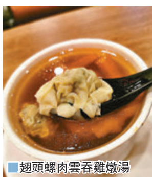
翅頭螺肉雲吞雞燉湯

說到中式飲食文化，最馳名的莫過於滋潤燉湯，加上餐廳名為嫵嫵雲吞雞，當然少不了雲吞雞，這兒有多款滋補養顏的燉湯，全以雲吞雞入湯，如翅頭螺肉雲吞雞燉湯、蟲草花雲吞雞燉湯、椰子雲吞雞燉湯、羊菌雲吞雞燉湯、花旗參螺頭雲吞雞燉湯及沙參玉竹雪梨雲吞雞燉湯，廚師每天用6小時熬製原盅燉湯，食材新鮮，保證足料。喝完燉湯後，千萬別忘了品嚐燉湯裏的食材。香港人生活忙碌，經常熬夜，來喝一盅滋潤的燉湯，打起精神！