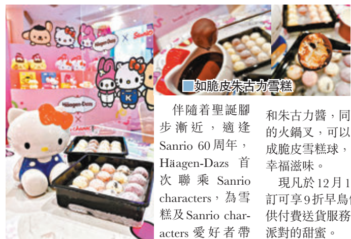
如脆皮朱古力雪糕

伴隨着聖誕腳步漸近，適逢Sanrio 60周年，Häagen-Dazs 首次聯乘 Sanrio characters，為雪糕及 Sanrio characters 愛好者帶來一系列節日獻禮，當中最大特色是推出三位人氣活潑角色 Hello Kitty、My Melody、Pompompurin 造型的限定雪糕火鍋套裝，而雪糕蛋糕及季節限定派對冰袋套裝亦率先登場，讓一眾粉絲感受佳節喜悅。