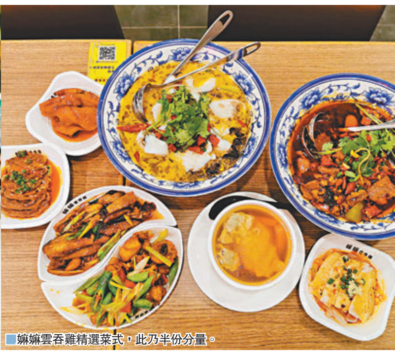
嫵嫵雲吞雞精選菜式，此乃半份分量。