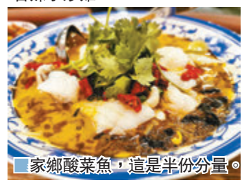
家鄉酸菜魚，這是半份分量。