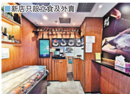
新店只設立食及外賣