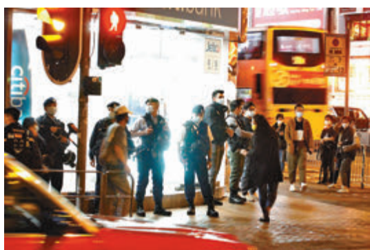
▲警方昨晚在港鐵太子站對面行人路架起封鎖線。

到傍晚6時許，只有數名「市民」帶同鮮花到場，但僅於行人路行經，或站對面馬路駐足或徘徊。其中一男子帶同一個載有鮮花的紙箱到場，聲稱要向市民派傳單，提醒他們勿犯「限聚令」，但被在場警員勸喻離開，最後交出紙箱，繼續在場派傳單。