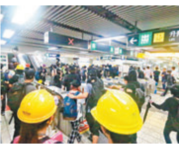
▲攬炒黑暴於去年9月1日闖入多個港鐵車站內大肆破壞。資料圖片

辯方昨日求情指，雖然被告在勞教中心報告內否認控罪，不過，案件發生至今一年，經審訊後被告已還押14天，已知自由的可貴，承諾今後會安分守己，不會重犯，而且被告體能上不適於勞教中心，希望法庭考慮控罪性質及背景情況，再