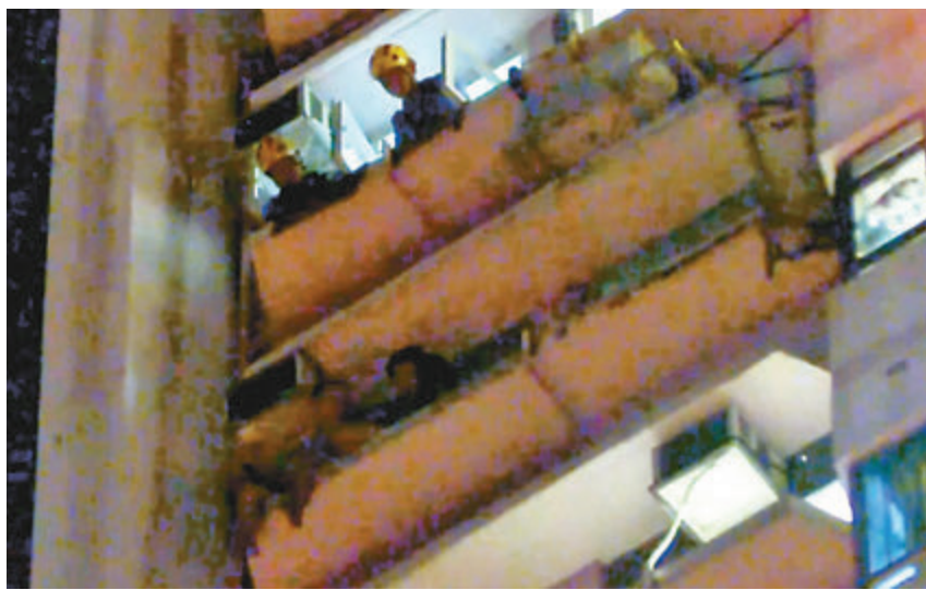
▲警方去年10月1日凌晨在灣仔駱克道搗破武器庫時，有疑犯一度爬出窗台拒捕。資料圖片