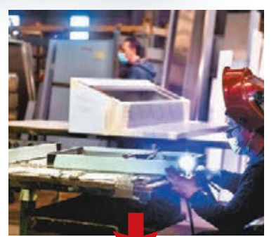
工人忙於製造冷藏疫苗的凍櫃。

美國聯合航空公司前日開始安排包機，準備運送輝瑞藥廠研發的新疫苗，一旦疫苗獲食品及藥物管理局(FDA)緊急授權使用，便可迅速分發。美國聯邦航空管理局(FAA)表示，正支援「疫苗的首次大型航運」，目前與航空公司合作，確保疫苗安全運送各地。 聯航計劃安排包機來往布魯塞爾國際機場和芝加哥奧黑爾國際機場，負責運送疫苗。由於輝瑞疫苗需在超低溫下儲存，故聯合航空已獲FAA許可，在每班包機上攜帶1.5萬磅乾冰，是平日上限逾5倍。輝瑞亦特別設計用作裝載乾冰的疫苗儲存盒，避免使用大型冷藏櫃，方便運送疫苗。其他航空和運輸公司亦密鑼緊鼓展開疫苗運送的準備工作，美國航空公司已安排班機從邁阿密試飛至南美洲，測試運送過程中的溫度控制和物流程序。聯邦快遞和DHL已推出溫度監察系統，追蹤疫苗運輸。