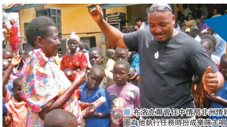
布洛克爾曾任中情局非洲情報分部負責人。圖為他執行任務時扮成樂隊主唱。