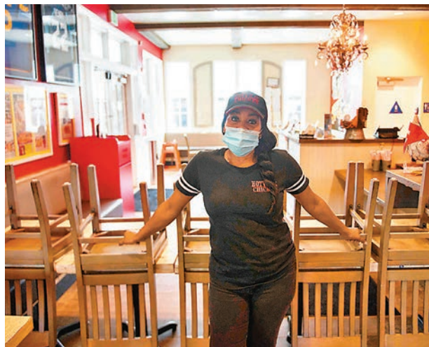
食肆繼續禁止堂食，餐廳東主難以維持生計。