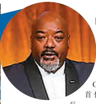
報告稱，布洛克爾於情報界擁有32年經驗，包括曾任職空

美國候任總統拜登陸續公布內閣人選，據霍士新聞台報道，拜登擬提名中央情報局(CIA)非裔前高官布洛克爾執掌CIA，將成為美國首位黑人中情局局長。 報告稱，布洛克爾於情報界擁有32年經驗，包括曾任職空軍分析師4年，以及於中情局工作28年，曾任中情局非洲情報分部負責人，於2018年退休，目前擔任跨國保安公司MOSAIC運營總監。霍士新聞引述消息人士透露，拜登團隊於大選後數天，便與布洛克爾接觸，目前仍在討論階段。 據美媒統計，拜登的過渡團隊在情報領域方面共有23名成員，其中9人為少數族裔。 ■綜合報道