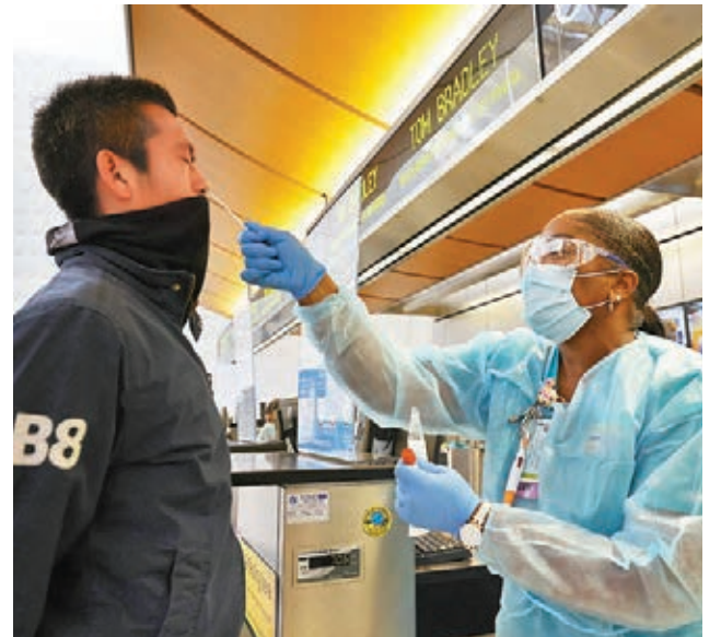
不少民眾無視警告，繼續在感恩節出行。圖為機場職員為旅客量度體溫。