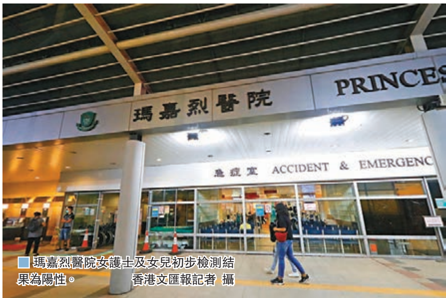
瑪嘉烈醫院女護士及女兒初步檢測結果為陽性。