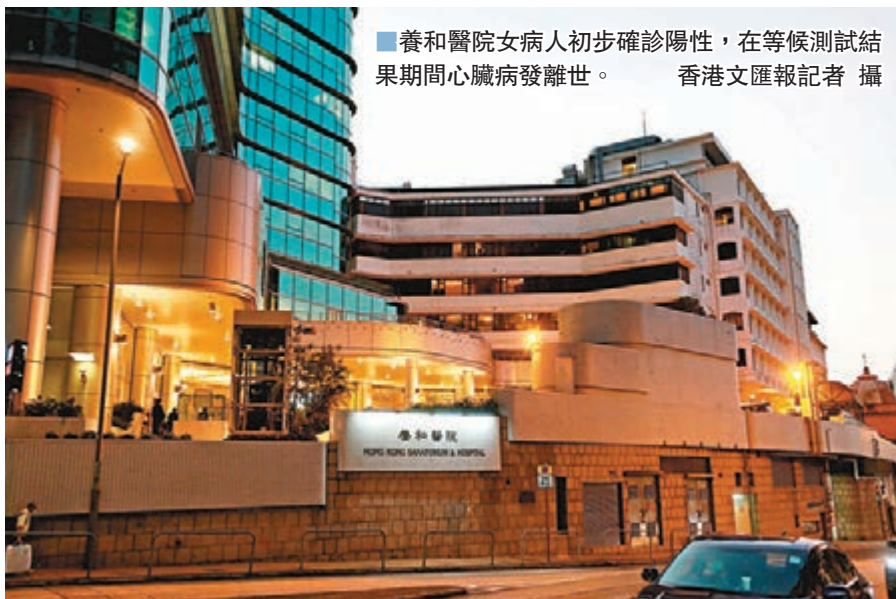
養和醫院女病人初步確診陽性，在等候測試結果期間心臟病發離世。